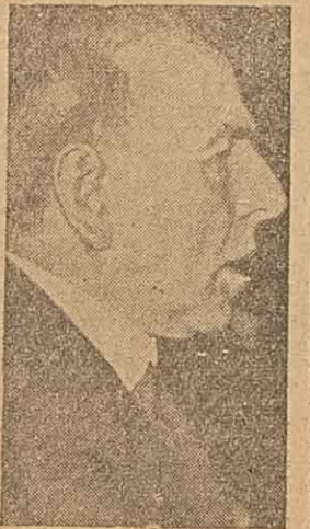
Dr. Nicolás Repetto

BUENOS AIRES, 5. — En forma definitiva ha quedado integrada la lista de precandidatos a senador y diputado nacional que utilizarán los afiliados del Partido Socialista en la Capital Federal para elegir la lis-