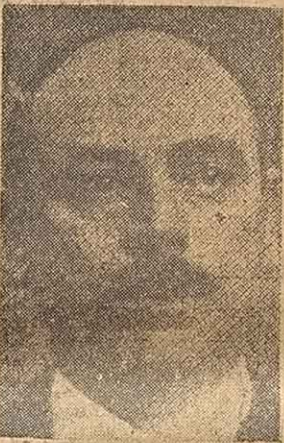
Dr. RAFAEL ARAYA

ANULADO el plan del vice gobernador con distintos pretextos no lo sustituye el oficialismo con ningún otro. Los diputados nacionales que enviaron Buenos Aires propusieron subsidios que correspondían a la provincia. Pidieron partidas excesivas como si lo animara más móvil que desamparar a la opinión pública con sumas infladas. Por ahí se les ocurrió crear sobre el papel, sin organización, ni personal, ni alimentos, una casa cuna. Fué preciso advertirles que no era cuestión de subir a la luna o de bajarla. Conformáronse entonces con la cifra que consiguiere el diputado Biancofiore, — a quien no juzgaban como de su sector, — es favor del Hospicio de Huérfanos, que sostiene una sala cuna. No se distinguieron, invocando a la jerarquía del mandato, como paladines del fuero federal. No les cerró la audacia la autonomía. Presentaban casi a Santa Fé como a un lugar desvalido, La Rioja, que implorara perdón y gracias.