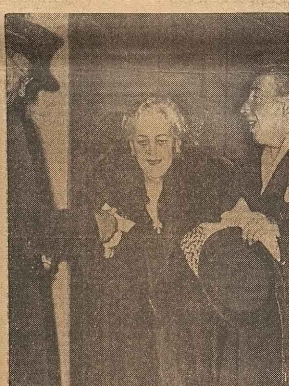
Uno de los actos más trascendentes entre la aristocracia neoyorquina es la apertura de la temporada de óperas. En esa noche se congrega en la antigua Metropolitan House todo lo que más vive en la alta sociedad norteamericana para "oir, ver y ser visto". En esta instantánea vemos a la señora madre del Presidente Roosevelt al llegar a la ópera, acompañada del célebre Joyero Pierre Cartier.