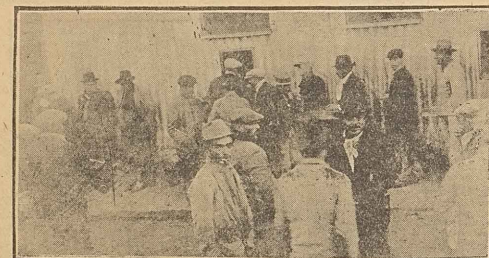
Los obreros estibadores desfilan ante la ventanilla del capataz antes de entrar a trabajar para presentar el carnet que les obligan las autoridades marítimas