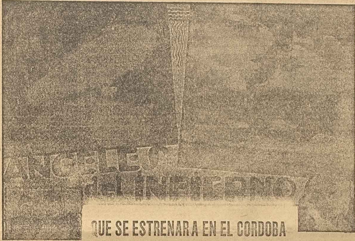
QUE SE ESTRENARA EN EL CORDOBA

Antes de la partida, Monte quiere festejar la empresa mientras que Roy hace una visita a Elena. Al encontrarse, ve que ella está en brazos de un oficial junto a la mesa de un café. El amoroso descubrimiento permite a Monte convencer a Roy de que Elena no es digna de su atención. Desilusionado, Roy va con su hermano a reunirse con dos bellas francesas deseadas de divertirse antes de su peligroso vuelo. Llega el momento heroico, Monte