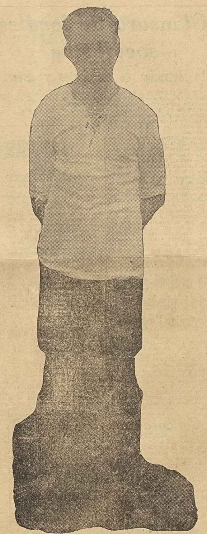
Cuya reaparición es ya inminente

sentación frente a Newell's Old Boys, obtuvo honrosa victoria, por 3 goles a 1, ratificando con ello, cuanto había demostrado en la pretemporada, perfilándose como equipo capaz