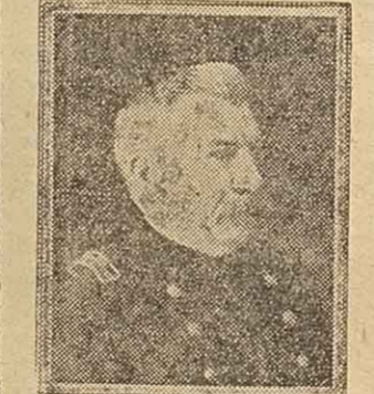
Contraalmirante ABEL RENALD

BUENOS AIRES, 9. — Concurrió al Ministerio de Marina, haciendo su presentación reglamentaria, el ex-titular de esa cartera, contraalmirante Abel Renald, quien se hizo cargo de la Dirección General de