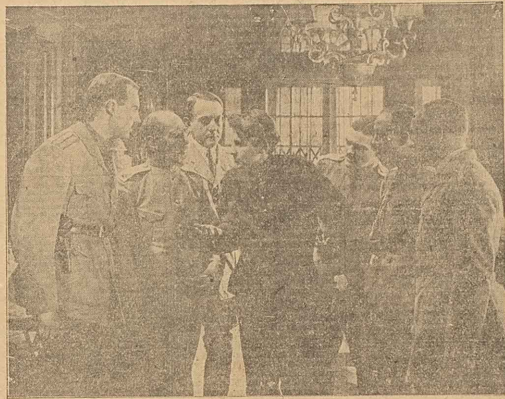
Una interesante escena de la película "Dos días", que se exhibirá próximamente en el Colón