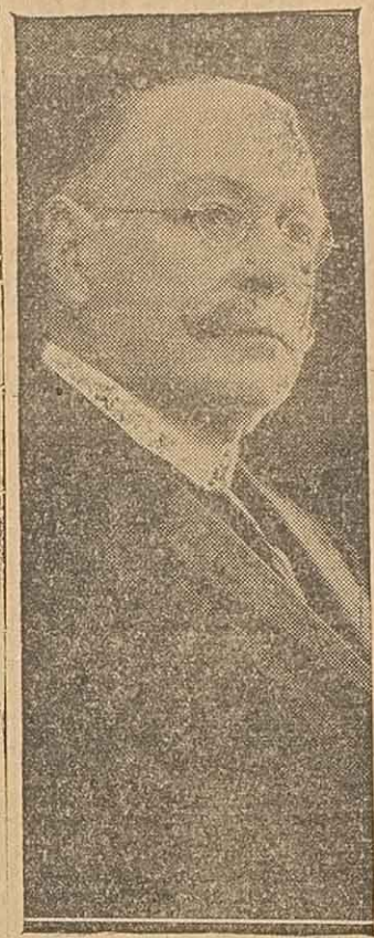
DR. LOPEZ tafecino. Un diario enemigo "Crítica", cuyo director nunca es una definición, y cuya moral ha sido definida, jue-

Los conservadores, desde Buenos Aires, hacen esfuerzos, aun entre los radicales, para quebrar la inteligencia partidaria que está regocijando al pueblo opositor san