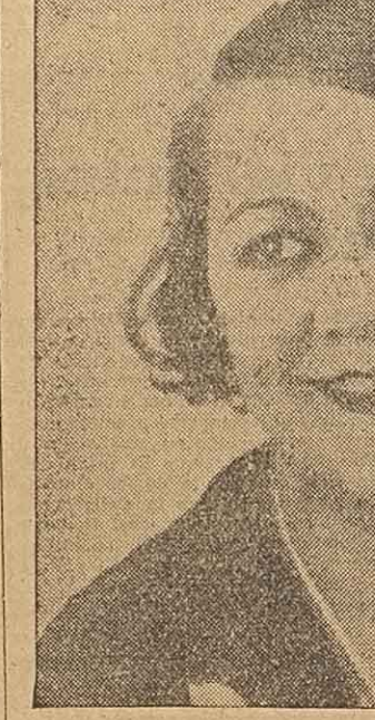
Inteligente actriz que será homenajada esta noche en el Odeon. En la sección teatros de esta edición se podrá leer la información correspondiente.