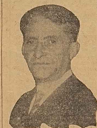
DOCTOR DE ANQUIN

SANTA FE, 27. — Recíbiase el siguiente telegrama del departamento General Obligado: