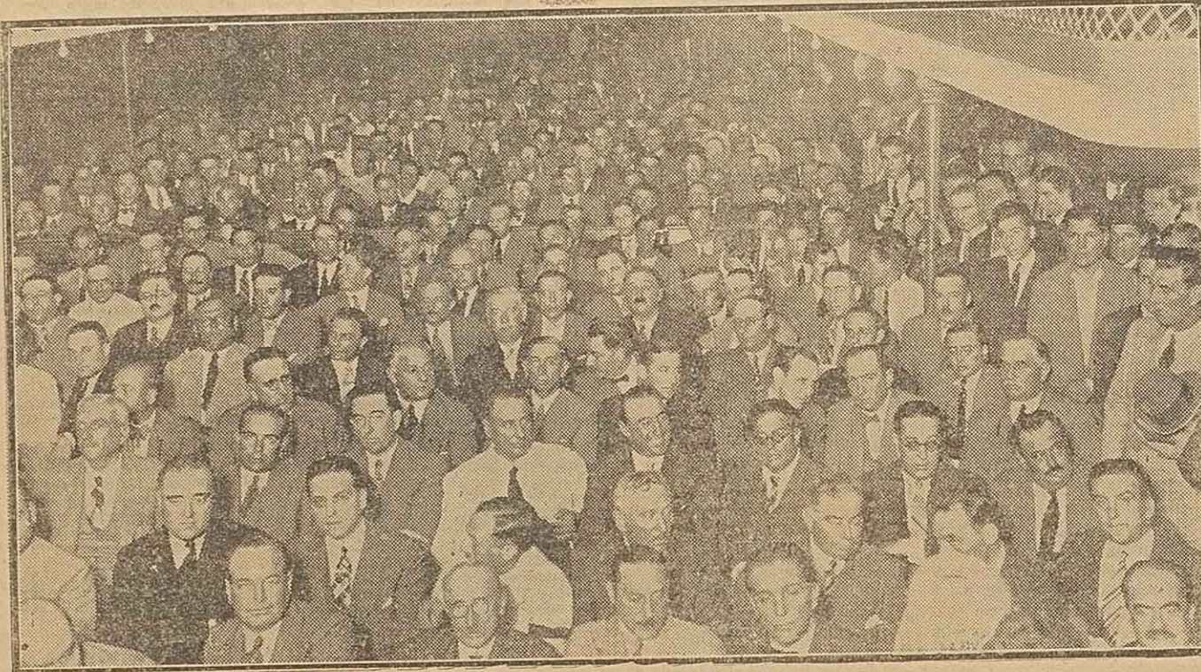
La platea del cine Avenida, de La Plata, ocupada por los convencionales radicales