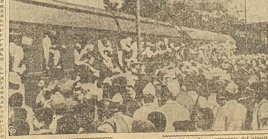
CONTRIBUCION DE TURQUIA A LAS NACIONES UNIDAS. Un contingente del ejército turco parte de Izmit, por Ferözcarril, en la primera etapa de su viaje al frente de Corea. En total irán 4.000 hombres para combatir en los ejércitos de las Naciones Unidas.