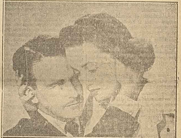
UNA ESCENA del interesante film Universal "Tras el espejo", que con éxito se exhibe en el cine Palace. Aparece en el grabado, Olivia de Havilland y Lew Ayres, pareja central del reparto.