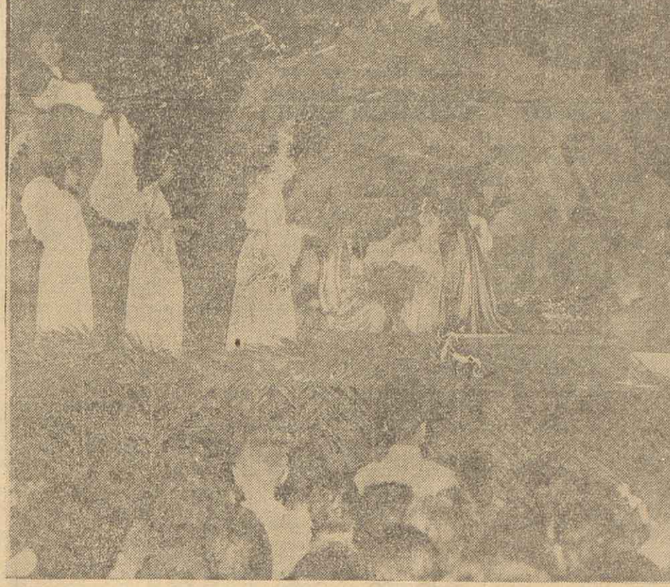
En el Parque Urquiza realizó anoche la representación de la Navidad, que organizó el centro católico Stella Maris, de la Catedral. Extraordinaria cantidad de público congregó ante el pesebre que fueron reconstruidas las escenas principales de la llegada de María y José a Belén. La reunión, auspiciada por la Municipalidad, contó con la asistencia del obispo de Rosario y los obispos auxiliares, así como de la participación de coros notables y una escenificación adecuada.