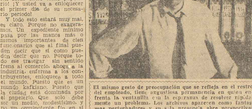
El mismo gesto de preocupación que se refleja en el rostro del empleado, tiene angustiosa permanencia en quien enfrenta la ventanilla con la esperanza de resolver rápidamente un problema. Los archivos aparecen como fantasmáticas perturbadoras y su presencia abre perspectivas sombrías.

Desconocido amigo: Desde el último viernes no hablamos con usted. Hoy, por ser lunes, reanudamos el diálogo, deseándole, en primera instancia, que algún premonido de la lotería haya quedado en su bolsillo. Luego de esta introducción, que quiere ser cordial, vamos a los papeles. ¿A dónde? Si a los papeles. Porque nuestro tema de hoy es específicamente municipal y tiene un nombre terrible: burocracia. Porque los rosarios, con nuestro voto de fines de febrero, lo cobijamos (indirectamente) a usted a entrar en el palacio de los leones. Y usted, agenda en mano, agradece como de costumbre se agradece, y después quedará en su despacho y se sentará a meditar dos minutos. A meditar en la ciudad, en el destino de la Patria, en Rosario y su rostro enamorado.