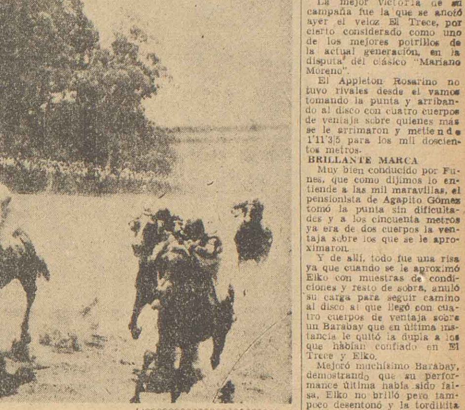
La Ahogaron el Grito al "Bolsero" Cuando se Levantó el Trono... El hombre le esperaba tranquilo. Estaba sentado en el "trono" con una pose que...