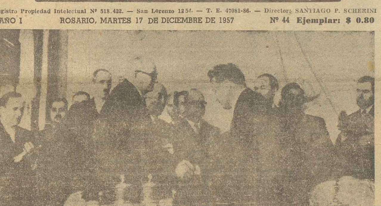
La fotografía muestra el salón donde se firmó el acuerdo económico entre Siria y la Unión Soviética. Por este acuerdo la República de Siria recibirá en préstamo la cantidad de 300 millones en armamento militar y en un largo plazo, y con un interés muy bajo. Estrechándose las manos aparecen el ministro de defensa sirio, Kaled el Azam a la izquierda, y el vicepresidente soviético Joseph Kuzmin. Los otros dos personajes que aparecen en la foto son el embajador sirio Eddin Tarasi y el ministro de Relaciones Exteriores soviético Andrei Gromiko. — (Radio-foto de International News).