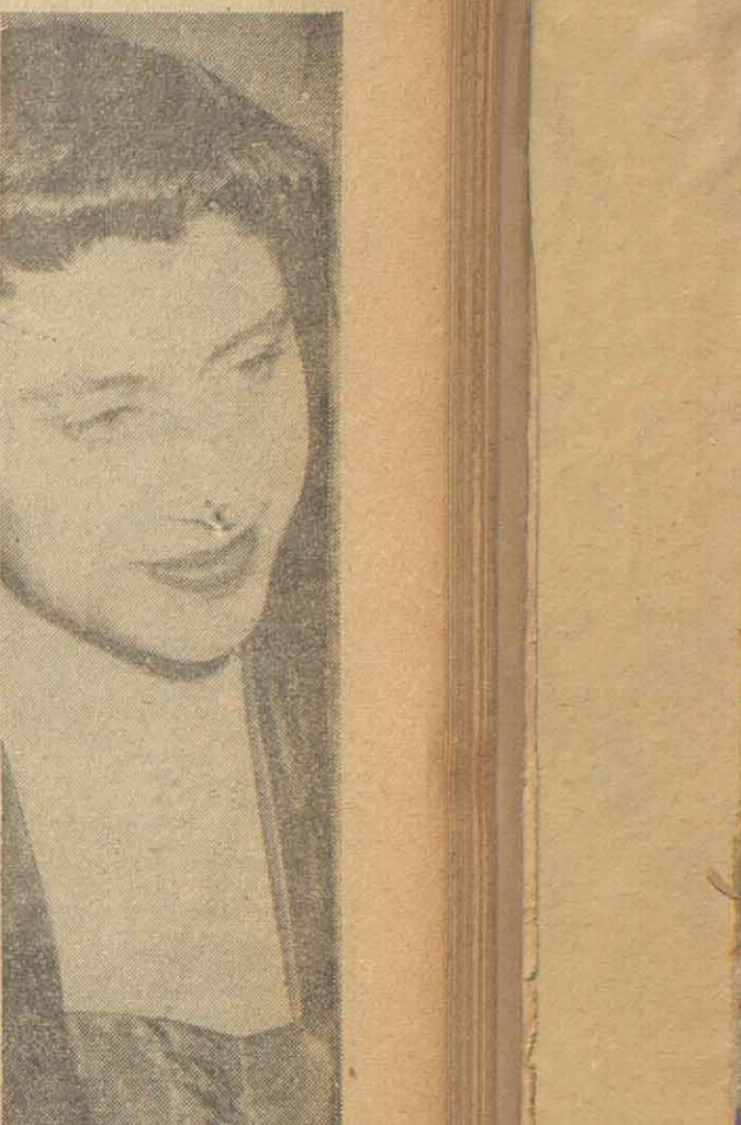
La princesa Margarita, al dar el primer discurso en la reunión suprema de la Organización del Tratado del Atlántico Norte (NATO), dijo que el futuro de la humanidad depende de la cooperación entre Oriente y Occidente.

Son numerosas las notas gráficas que han sido tomadas en relación con los desórdenes registrados en Chile. La que reproducimos adquiere singular patetismo. Muestra a un policía llevando en brazos, arrodillado, a un estudiante herido que participó activamente en una refriega en la Escuela Secundaria de Nicosia. Los estudiantes que venían en grupos, lograron tomar la escuela y reemplazar la bandera inglesa por la de Grecia. Al ser desalojados, veinte muchachos fueron arrestados y seis policías resultaron con diversas heridas.