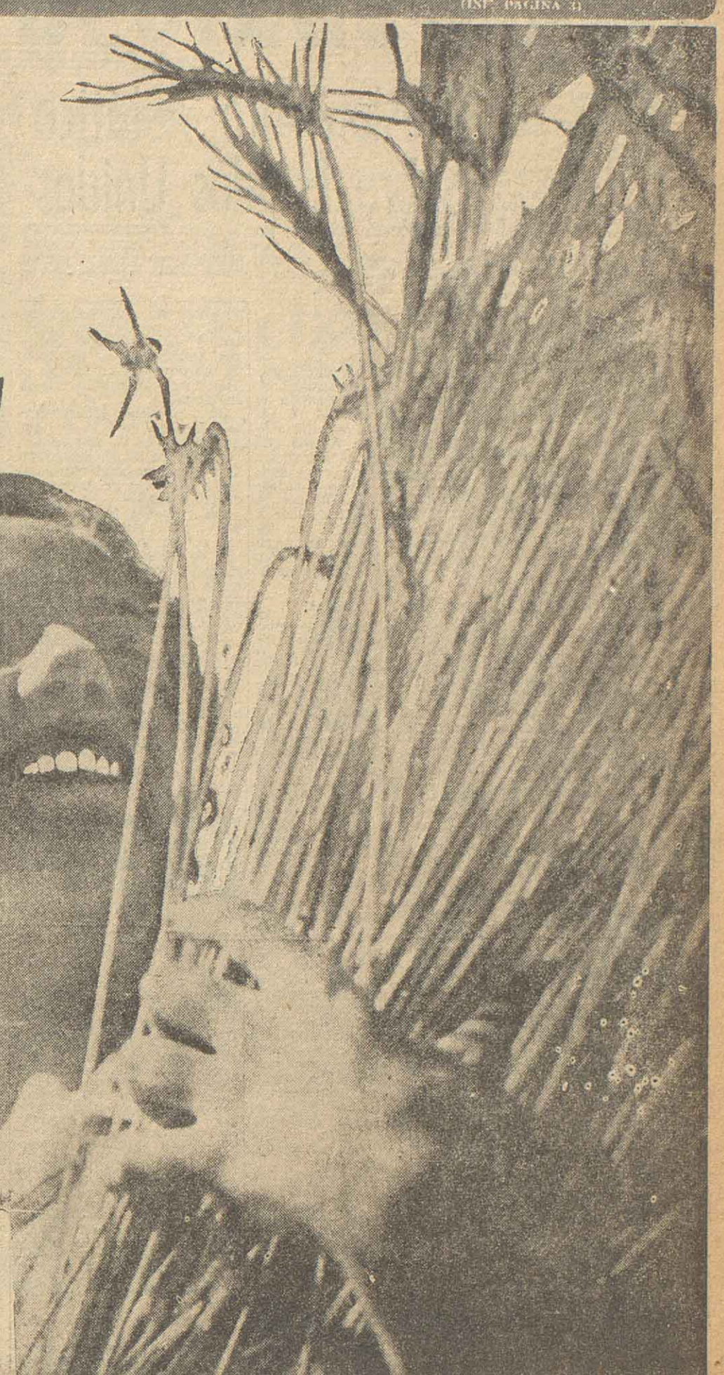
El oro de las pampas: el trigo, cuya recolección se inició hace pocos días en la zona "Rosa Fe", comenzó a ser adquirido hoy por la Junta Nacional de Granos de nuestra ciudad. El símbolo de los trigales sobre los que se cansa el viento, según la expresión de Lugones, planea hoy por sobre las cifras, también importantes, de la comercialización del grano, porque es pan, pero también es bolsa.

BAHIA, 2 (AP). — El rey Feisal expresó ante el Parla-