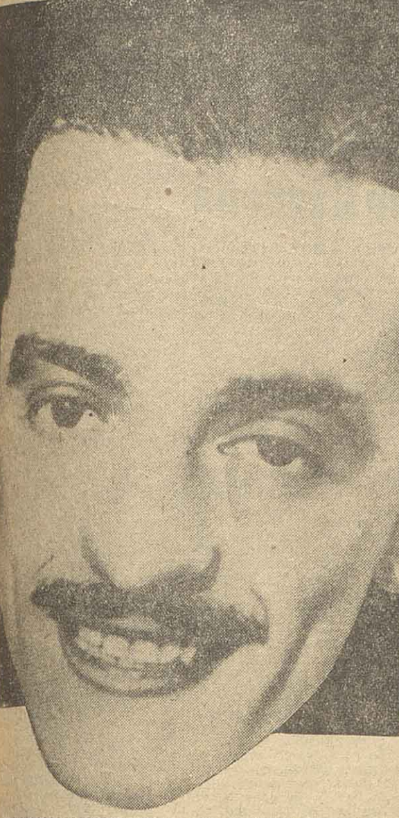
Juan Galvez volvió hoy a justificar su condición de campeón, al ganar una de las etapas más difíciles del Gran Premio Argentino de Carretera de 1957.