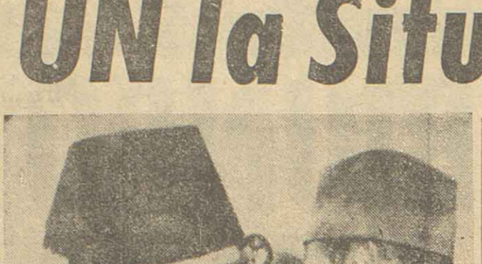
A su regreso de los Estados Unidos, adonde concurrió para celebrar conferencias con el presidente Eisenhower...