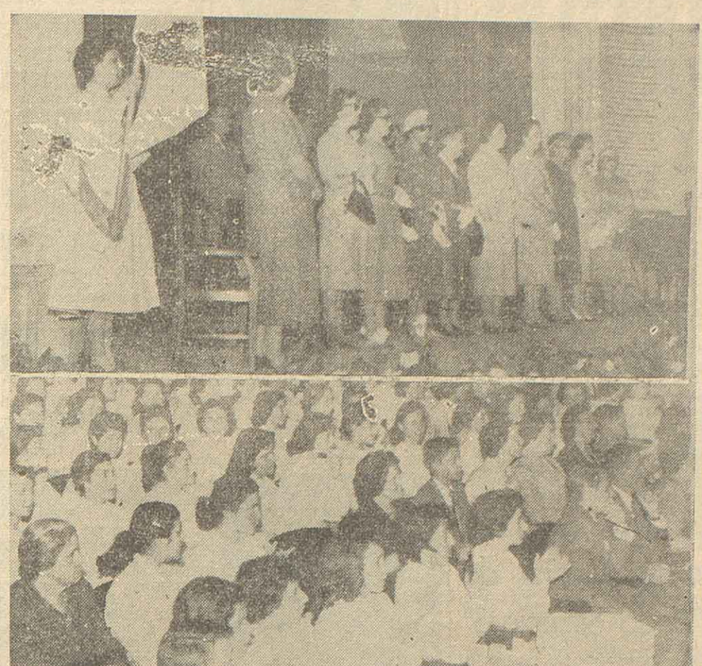
Esta mañana se llevó a cabo en la Escuela Normal N.º 1 de Profesores...