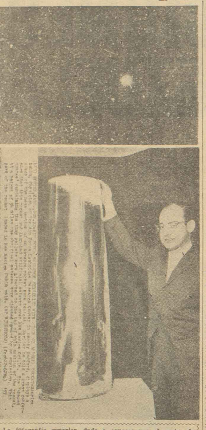
La fotografía superior, dada a conocer por el centro de investigaciones de Cambridge, fue tomada en ocasión de la explosión de un cohete artificial lanzado por un cohete Aerobee, hace pocos días. La foto fue tomada desde el Pico Sacramento, en Nueva Méjico, pudiendo verse fragmentos de la explosión. En el grabado inferior un físico estadounidense muestra la parte superior del cohete "Aerobee" con que se lanzaron los cohetes artificiales y que voló a tierra luego de la explosión.

Ambos gobiernos se adheren firmemente a los principios de la UN, cooperando para promover los objetivos pacíficos de esta organización. Dulles aseguró a demás al soberano que los Estados Unidos "continúan su actitud respetuosa a favor de una solución pacífica, democrática y justa del problema argelino."