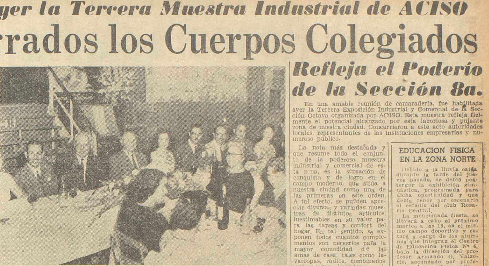
Ayer, con motivo de conmemorar su VIII Aniversario y clausura de la III Gran Exposición Comercial e Industrial, organizada por la Asociación de Comerciantes e Industriales Zona Sur, se realizó un banquete, que estuvo dirigido al gremio de la Reina recientemente consagrada por la entidad. La grata reunión, dio lugar a numerosos actos que concluyeron con el beneplácito de los presentes.

En una amable reunión de camaradería, fue habilitada ayer la Tercera Exposición Industrial y Comercial de la Sección Octava organizada por el ACISO. Esta muestra, realizada en la zona de nuestra ciudad, concurren a este acto autoridades locales, representantes de las instituciones empresarias y numeroso público.