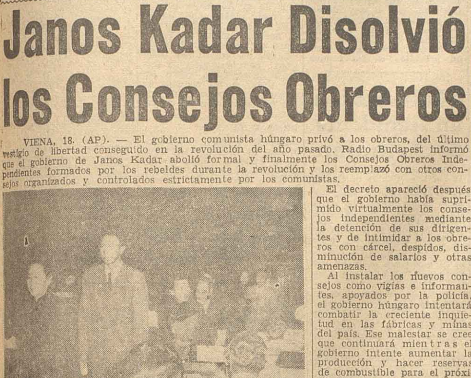
El delegado de China Comunista a la Conferencia Internacional de la Cruz Roja que se realizó en Nueva Delhi, se ha retirado después de una resolución de los delegados americanos aceptando los representantes de la República China fue aprobada. También se retiraron los delegados de la India y los de la Unión Soviética.