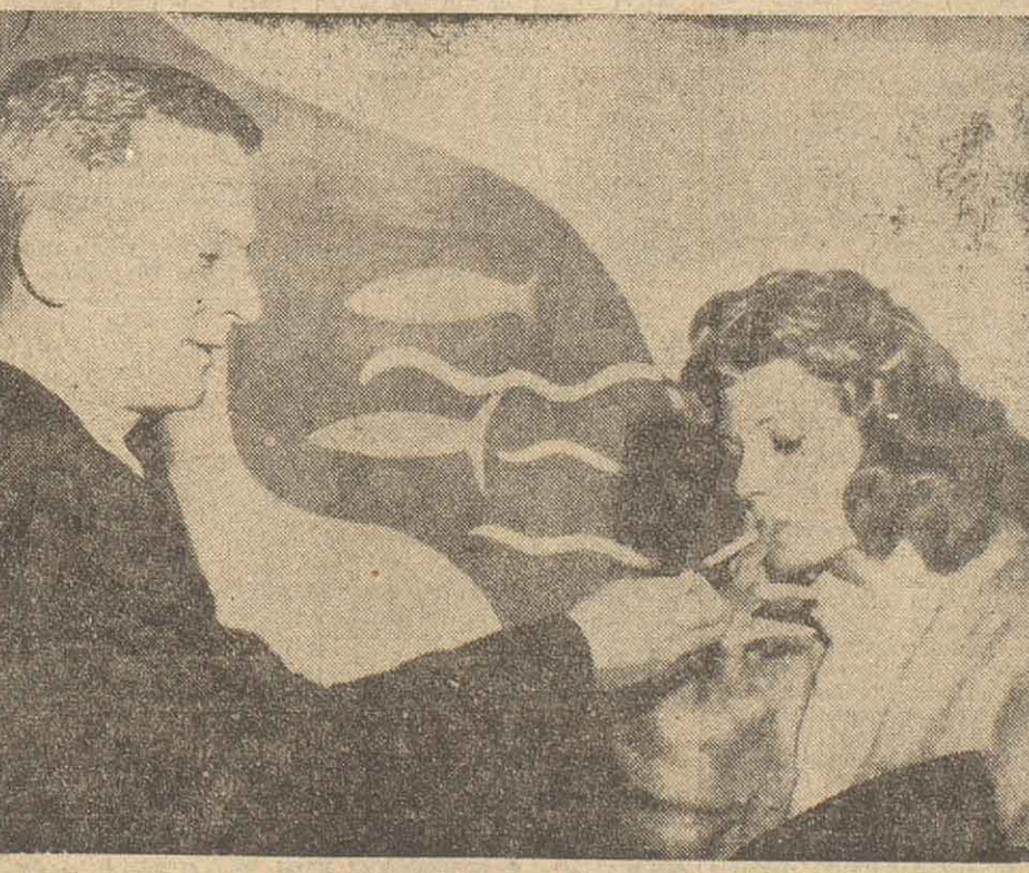
El caballero que le da la mano a Rita Hayworth en la fotografía tomada durante una reunión de periodistas es James Hill, de 41 años, escritor y productor de Hollywood, que contraxó enlace con la renombrada estrella cinematográfica para navidad. James Hill sería su quinto marido