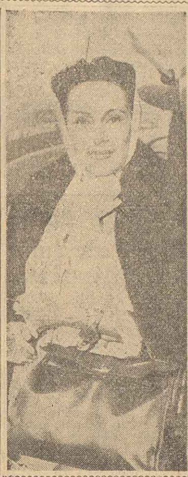
Dolores del Río, la famosa actriz mejicana, ha sido internada en una clínica romana, afectada de un ataque a la espina dorsal. A raíz de esa dolencia se le ha colocado un armazón de alambre que le sujeta el cuerpo a la cama totalmente inmóvil, debiendo estar así dos meses.

LABOR obligada, que nace de la misma responsabilidad del cargo ejercido, resulta para los gobernantes del siglo asegurar permanentemente los elementos de educar en popular tendencias a sembrar en la conciencia de las colectividades los múltiples beneficios que reporta a las naciones y al mundo el cultivo intensivo del