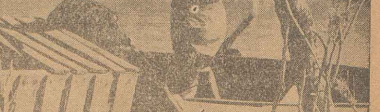
El trabajo de los pescadores de las islas es prácticamente desconocido. El film proyectado tiende a documentar claramente sobre cuanto actividad desarrolle el hombre de la orilla...