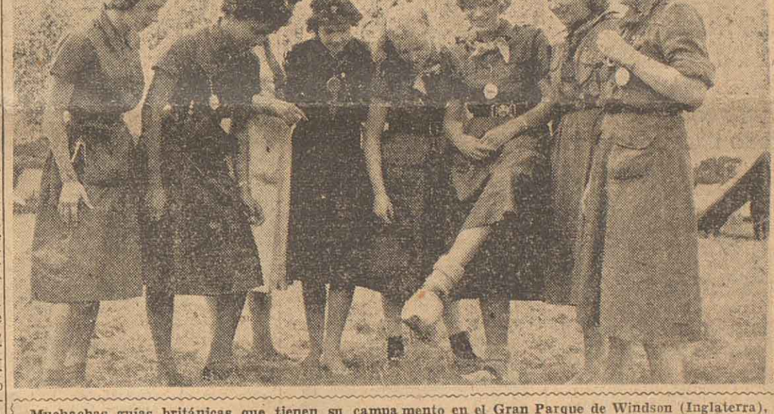
Muchachas guías británicas que tienen su campamento en el Gran Parque de Windsor (Inglaterra), recibieron recientemente a sus colegas, representantes de diversas naciones, en total 1.400 guías, con motivo de celebrarse el jubileo de dicho cuerpo y en homenaje a su creadora, Lord Baden Powell.

AÑO IV ROSARIO, DOMINGO 27 DE OCTUBRE DE 1957 N° 1399 Ejemplar: $ 0.80