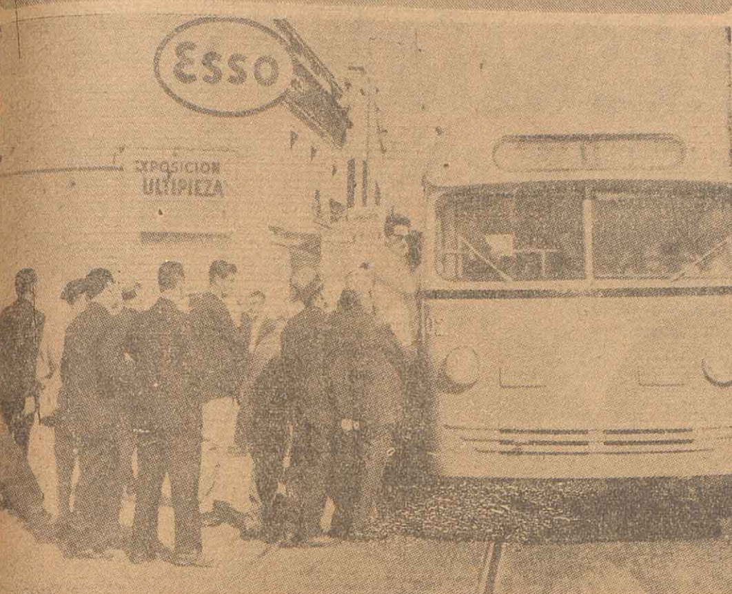
Los trabajadores pudieron concurrir normalmente a sus tareas, ya que los medios de transportes circularon en número adecuado para atender las necesidades de la población. En orden, formando las clásicas "colas", los pasajeros ascienden a un coche de la línea "B". De este modo, las autoridades contribuyeron a garantizar la libertad de trabajo en todas sus manifestaciones. El porcentaje de empleados y obreros que no asistió al para fue elevado, lo que contribuyó a que la ciudad mantenga su ritmo habitual.