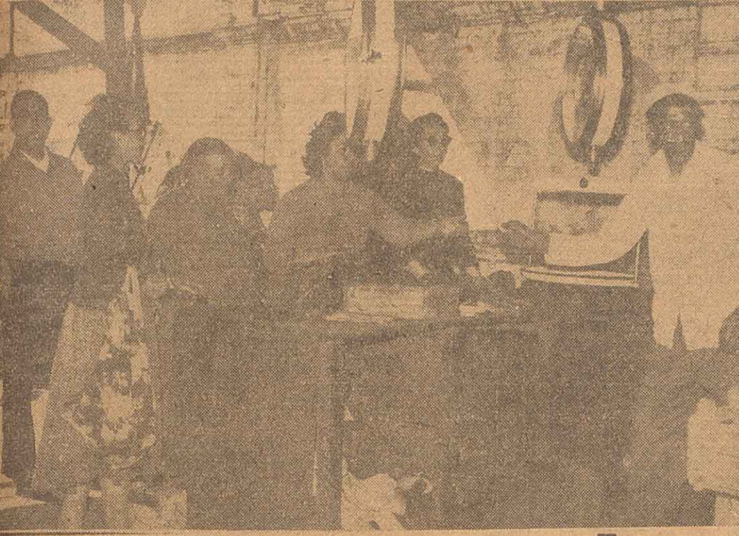
La ciudad no carecerá de los artículos de primera necesidad, anunció el gobierno. La nota gráfica, refiriendo esas palabras, pone de relieve la labor en las ferias municipales. Las zonas de casa concurren a proveer de verduras, carne, fruta y demás, en los establecimientos del ramo diseminados por la ciudad y que funcionan sin inconvenientes.