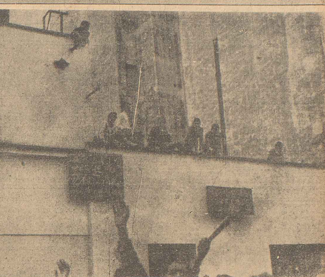
Los estudiantes de las escuelas industriales como señal de protesta y en refirmitación de su pedido de derogación de las disposiciones del Decreto de Reglamentación de Edificación que consideran perjudicial para los graduados, procedieron la víspera a ocupar los establecimientos educacionales en los cuates cursos que estudian. Esta escena corresponde a la Escuela Industrial N.º 4, sita en Calle Corrientes 672, donde puede observarse a jóvenes estudiantes encaramados al parapeto y en el frente carteles alusivos al conflicto. De acuerdo a las últimas informaciones recogidas, en fuentes generalmente bien informadas el conflicto estaría a punto de ser resuelto.