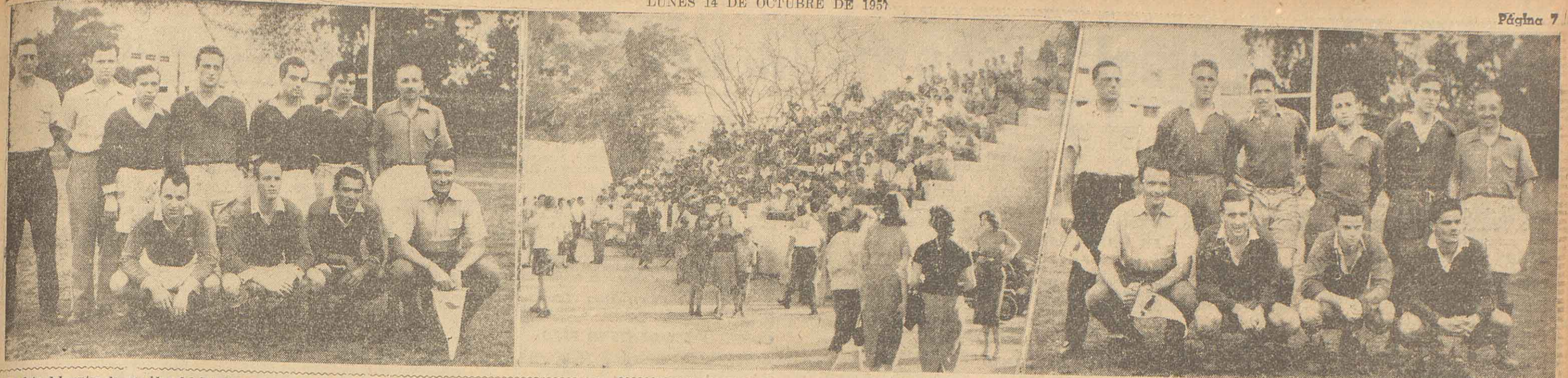
La foto del centro da una idea del interés que había despertado entre los aficionados locales el certamen "Seven-a-side", que para equipar de rugby organizara el Club Los Carancho. Un sector de los tribunales del estadio municipal "Jorge Nekbery", repedito de publi-