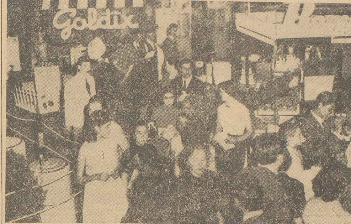
Un aspecto de la Exposición de Industria y Comercio inaugurada anoche y que fue patrocinada por la Asociación de Comerciantes e Industriales de Zona Norte. La misma constituye un verdadero exponente de la potencialidad comercial de la zona y fue visitada por numeroso público, que apreció los distintos detalles sobre los que ella ilustra. Como complemento artístico, continúa el desarrollo de la competencia para la elección de la Reina de la Zona Norte, cuyo acto final tendrá lugar en el Club Náutico Avellaneda.

UNA voz popular salida de ese conglomerado de trabajadores que coadyuvan a la recuperación del país, ha condenado severamente a los saboteadores de la actividad. También trabajan esas palabras una advertencia contra los muggos que desensuelven las fuerzas regresivas que buscan volver a apoderarse de la Nación para dirigir la vida sometida de su pueblo.