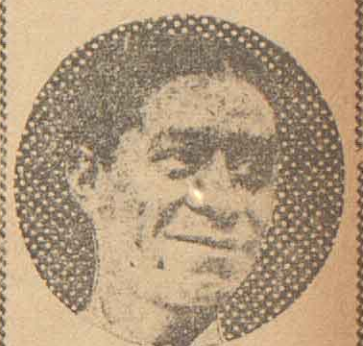
JOSE L. ANDRADE

Noticias procedentes de Montevideo, dan cuenta de la muerte del que fuera el más grande crack del fútbol uruguayo, José Leandro Andrade. Fue uno de los mejores jugadores más excepcionales de todos los tiempos, que haya brillado, con un fútbol que en la actualidad se considera en la constelación de estrellas, a cual más grande, que surgiera en los campos de fútbol del Río de la Plata, donde se ha practicado el mejor fútbol del mundo.