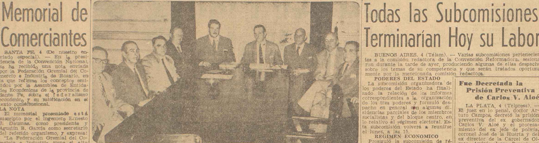
En la Asociación Comerciantes de Rosario celebró reunión en la víspera la Asamblea Permanente de Empresarios Pro Solución del Transporte en Rosario. En el transcurso de las deliberaciones, se decidió extremar los recursos ante las autoridades para que a la brevedad el servicio urbano de patentes...

SANTA FE 4 (De nuestro enviado especial) — Señalando el comienzo de la autonomía universitaria argentina, asumió ayer tarde sus funciones el primer Rector del tal elegido por el voto concurrente de los tres grandes sectores que integran la vida de las casas de más altos estudios del país: alumnos, profesores y egresados.