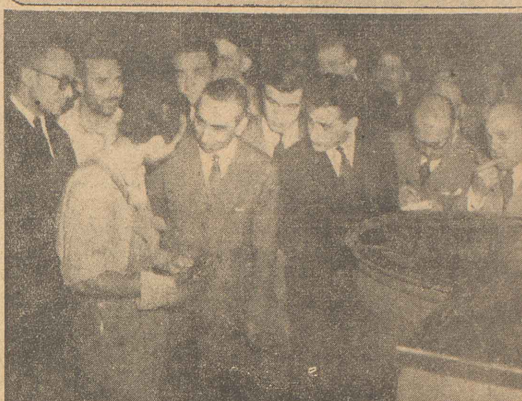
El vicepresidente provisional, contraalmirante Rojas, conversa con los trabajadores durante una pausa de la visita que realizó ayer por la mañana a la fábrica de la firma Pratti, Vázquez Iglesias S.A., de la localidad de Landa Oeste. En ella, más de 400 obreros y empleados que se dedican a la fabricación de acoplados, expresaron su opinión sobre problemas de actualidad, tales como el costo de la vida, el derecho de huelga, el trabajo incentivado, etcétera.

Por su parte, el decreto 12.835 transfiere en uso a título gratuito las unidades jurídicas de Chapadmalal, embalses de Río Toranzo y de Alta Montaña al Ministerio de Transportes de la Nación, El Departamento de Acción Social y de