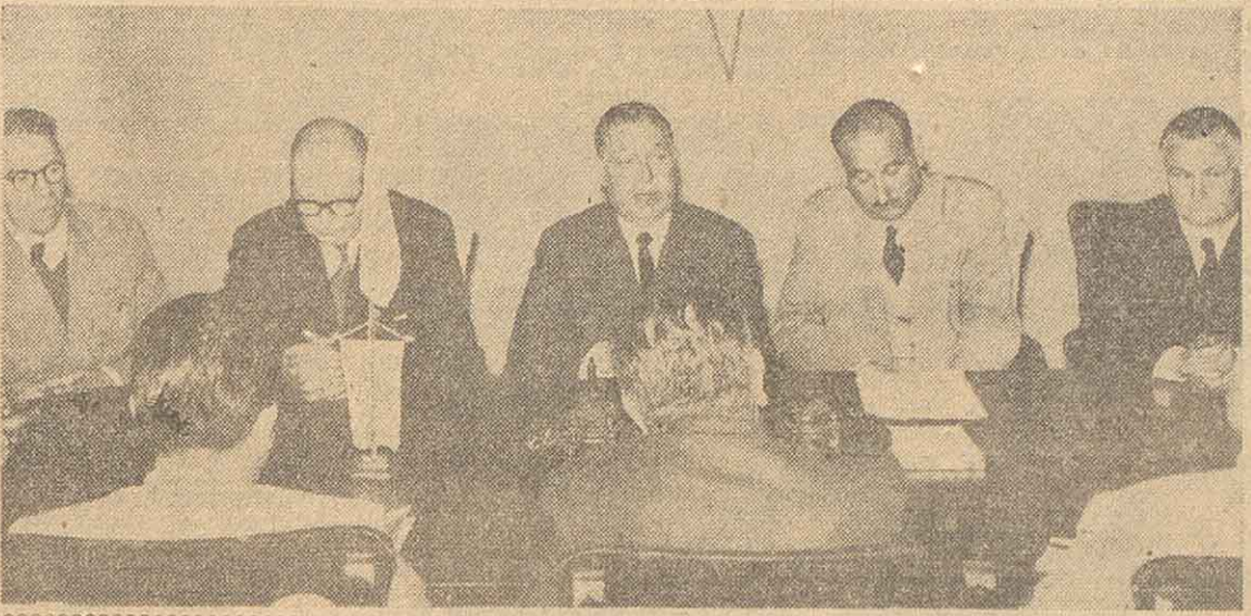
El Centro Unión de Almaceneros y Afines convocó esta mañana a los periodistas locales a los efectos de interiorizarlos de la situación actual...