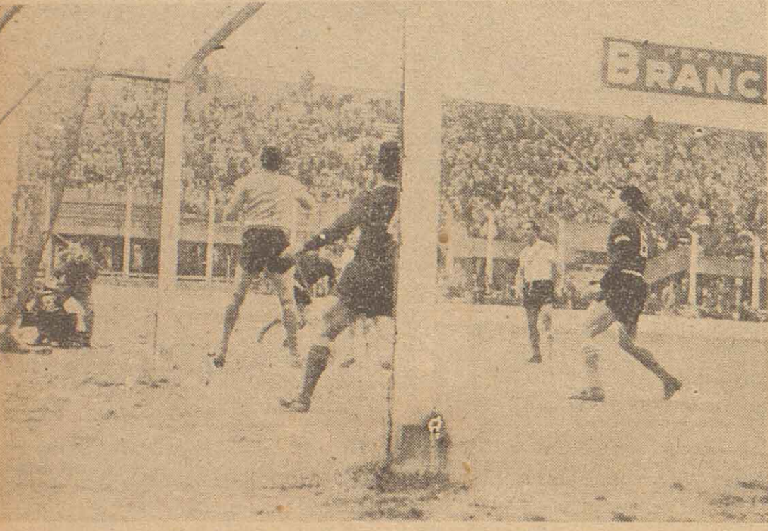
El disparo de Avilo, al que no había podido frenar Fontana, hace pasar la pelota cerca del ángulo izquierdo del arco de Right cuando éste había salido a cubrir sus posiciones. Lo vemos a Mastrogiuseppe corriendo para colaborar con su compañero. Miralles y el veterano Ferraro siguen la trayectoria de la pelota que se perderá detrás de la valla. Vélez aprovechó muy bien las fallas de Newell's Old Boys.