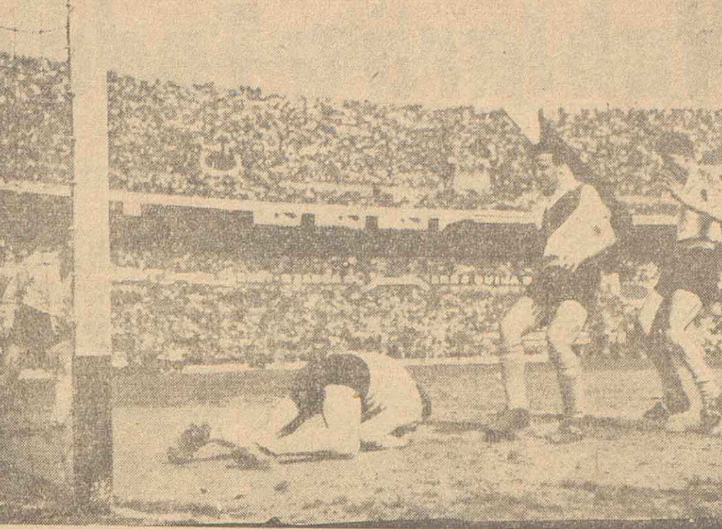
Arrojándose al suelo con decisión, Negri ha conseguido retener el estirio en su poder...