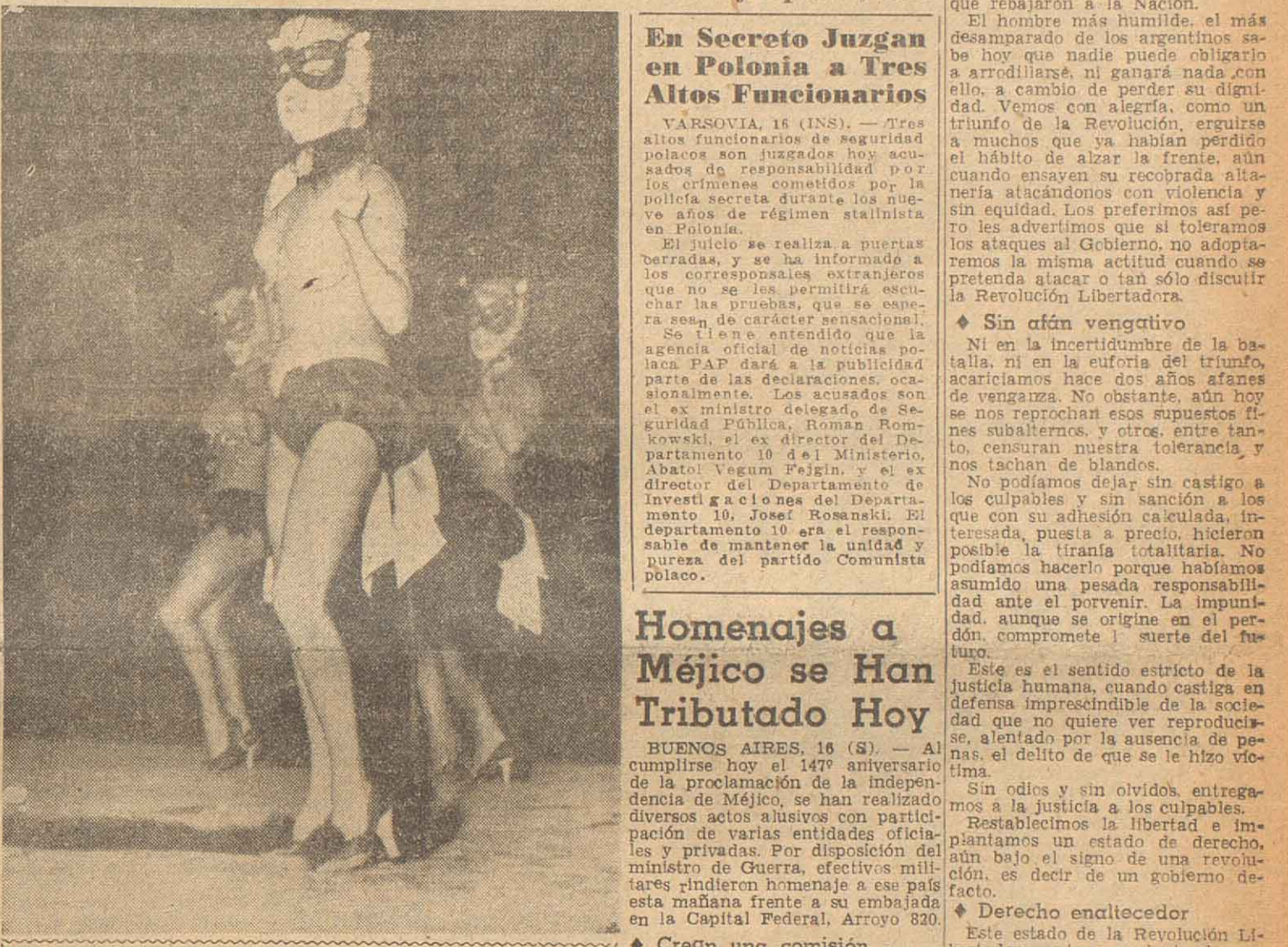
Al contemplar a la bella Vivian Blaine, no podemos menos que exclamar: "Qué placer sería estar en Las Vegas!"...

Reg. Prop. Int. No 518.422. — San Lorenzo 1254. — T. E. 47081-86. — Director: NOE LEON GUTMAN. AÑO IV ROSARIO, LUNES 16 DE SETIEMBRE DE 1957 N° 1351 Ejemplar: $ 0.80