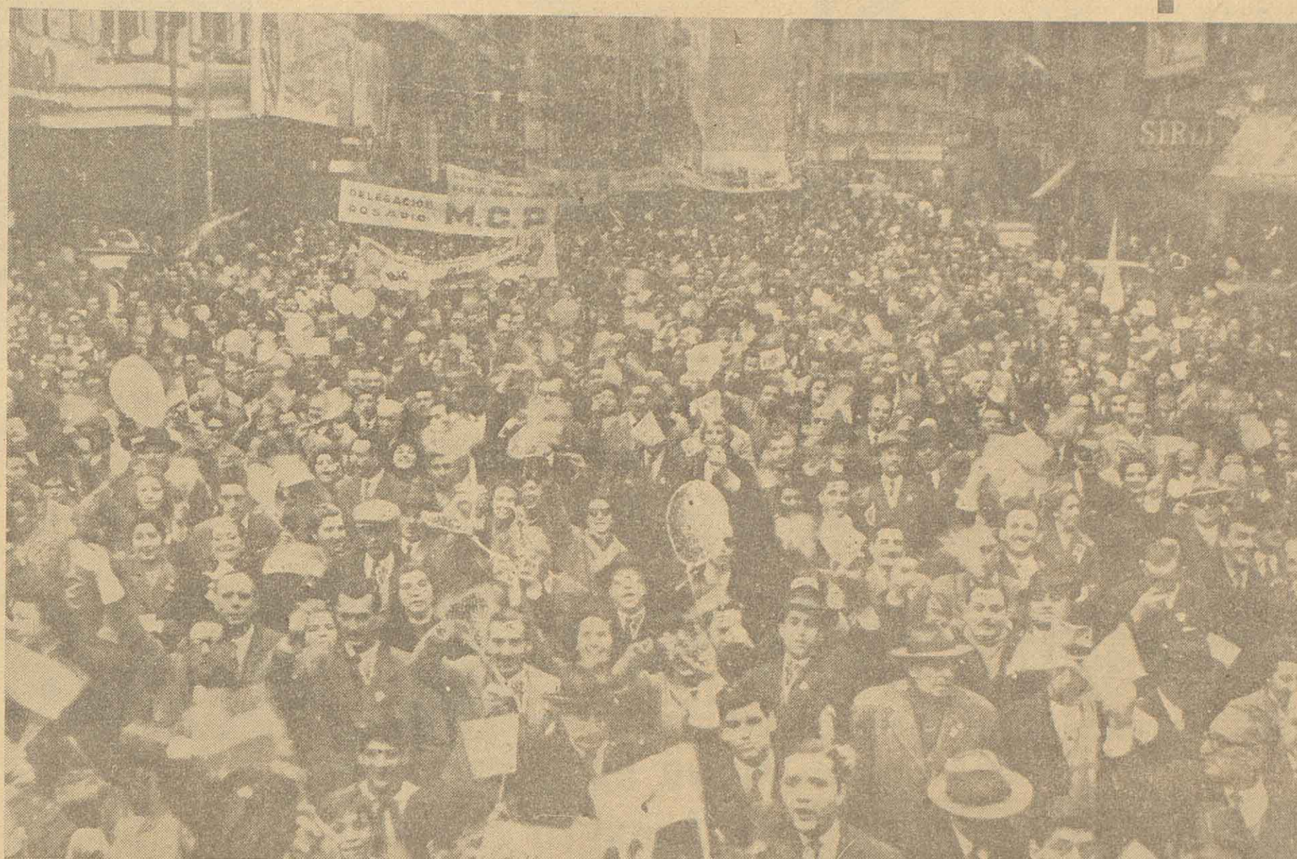
Auspiciada por la Comisión Permanente de Homenaje a la Revolución Libertadora, realizó en la víspera en la Capital Federal un desfile patriótico para conmemorar el segundo aniversario de la gesta del 16 de setiembre que abatió a la invidiable tiranía de la dictadura que durante diez años asoló al pueblo de la patria. Una imponente manifestación se dirigió desde la plaza de la República por avenida Corrientes y efectuó en la plaza del Congreso una vez más la reafirmación de su fe en los postulados democráticos de la Revolución Libertadora, que se gestó hace dos años en la heroica Córdoba y extendió sus ideales de libertad a todo el ancho y largo de la Nación.

UNA de las primeras cosas que hay que hacer, para aclarar el sentido de los fenómenos que pretendemos interpretar, es prescindir de la retórica, o mejor dicho, de las auto-definiciones. Esta es la razón de que no hayan sido pocos los que, al principio, dejándose llevar por un humanismo desorientador, o sea por las circunstancias de que también los acontecimientos de 1930 y 1943 se denominaron "revoluciones", sacaron conclusiones erróneas, en virtud de una analogía apresuradamente establecida. El método nos parece particularmente equivocado. De una similitud en las denominaciones, no se puede deducir una identidad real.