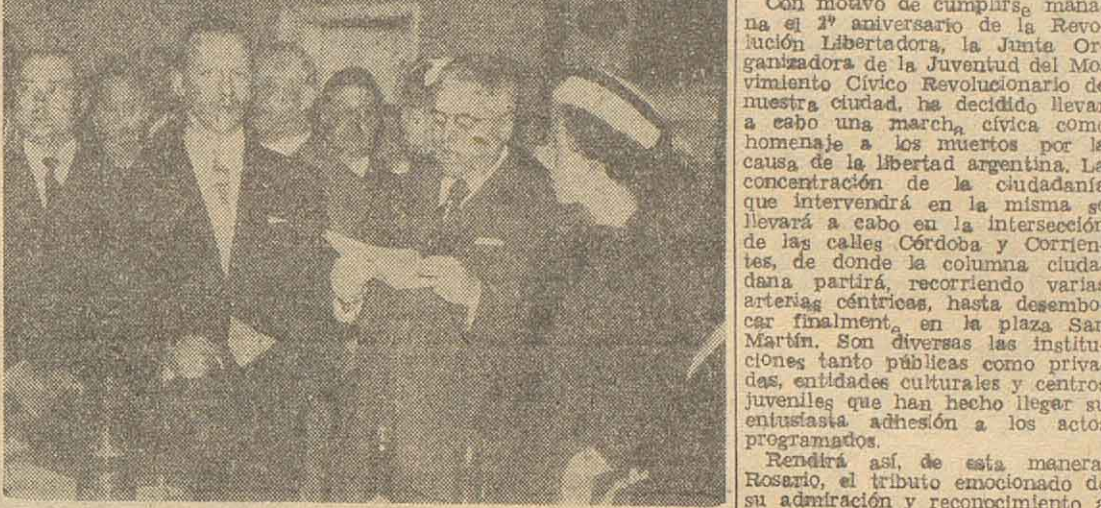
Con motivo de cumplir, mañana el 2º aniversario de la Revolución Libertadora, la Junta Organizadora de la Juventud del Movimiento Cívico Revolucionario de nuestra ciudad, ha decidido llevar a cabo una marcha cívica como homenaje a los muertos por la causa de la libertad argentina. La concentración de la ciudadanía que intervendrá en la misma, se llevará a cabo en la intersección de las calles Córdoba y Corrientes, de donde la columna ciudadana partirá, recorriendo varias avenidas céntricas, hasta desembocar finalmente, en la plaza San Martín. Son diversas las instituciones tanto públicas como privadas, entidades culturales y centros juveniles que han hecho llegar su entusiasta adhesión a los actos programados.

Renderá así, de esta manera, Rosario, el tributo emocionado de su admiración y reconocimiento a los bravos soldados de la libertad que posibilitaron con el sacrificio de sus vidas, el reencuentro de Argentina en los valores permanentes de la patria, resacudidos por los desahos de una tiranía que holló hasta los símbolos más caros del pueblo argentino y mancilló con su corrupción y la concupiscencia de un primitivo bárbaro las virtudes ciudadanas.