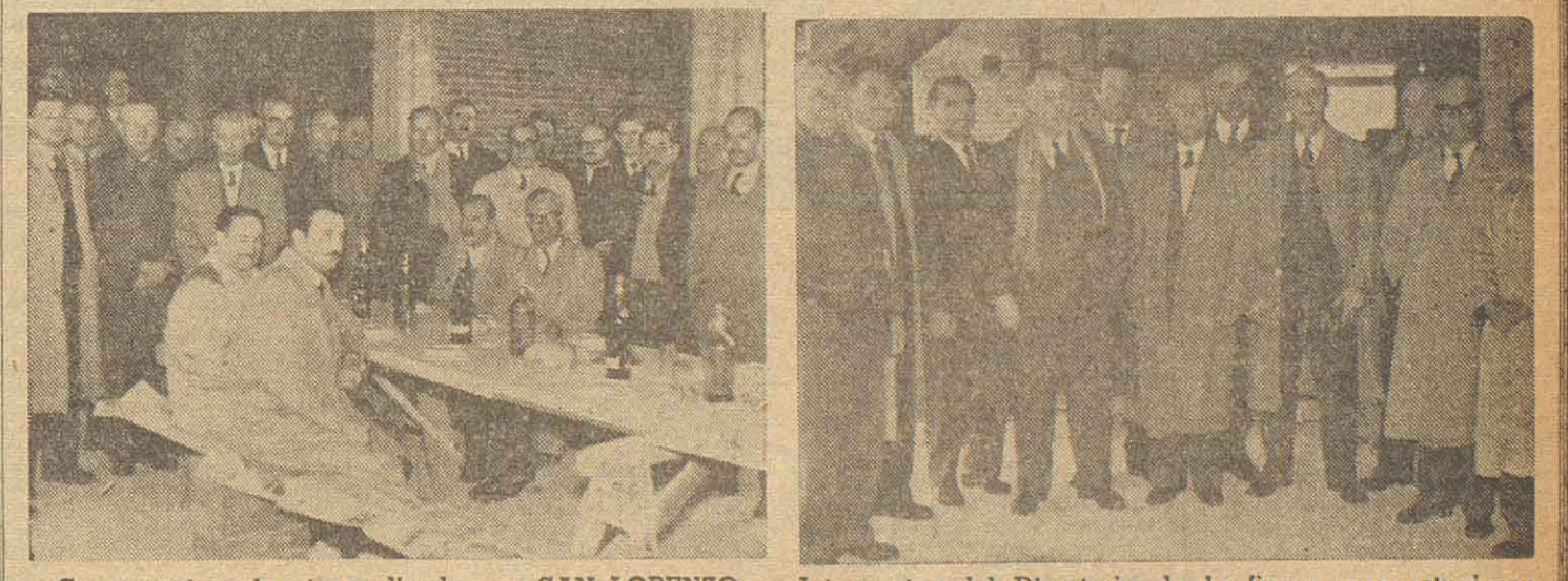
Concurrentes al acto realizado por SAN LORENZO INMOBILIARIA S. R. L. Integrantes del Directorio de la firma, que estuvieron presentes en la emergencia apuntada.

En el primer piso, de los locales que ya cuenta la GALERIA "SAN LORENZO", que se está levantando en la calle San Martín, se inició oficialmente las ventas de los locales de negocios, oficinas y viviendas de galería "SAN LORENZO". La inauguración de esta iniciativa, que enaltece a dicho importante centro social, comercial e industrial del litoral santafesino, ofreció una comedia criolla, que estuvo precedida de una visita y conocimiento del valor de la obra, a las autoridades oficiales de la dicha ciudad.