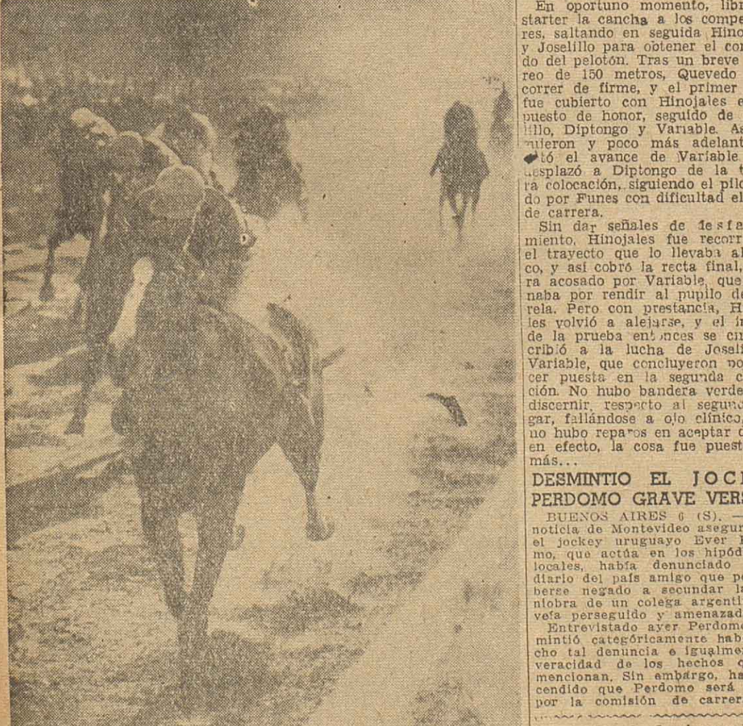
Parece buen Cardillo, por la forma en que se va a la carrera, dando se expuso de punta a punta. Aquí aparece de oreja, mientras que respetable distancia asoman Diptongo y Variable.