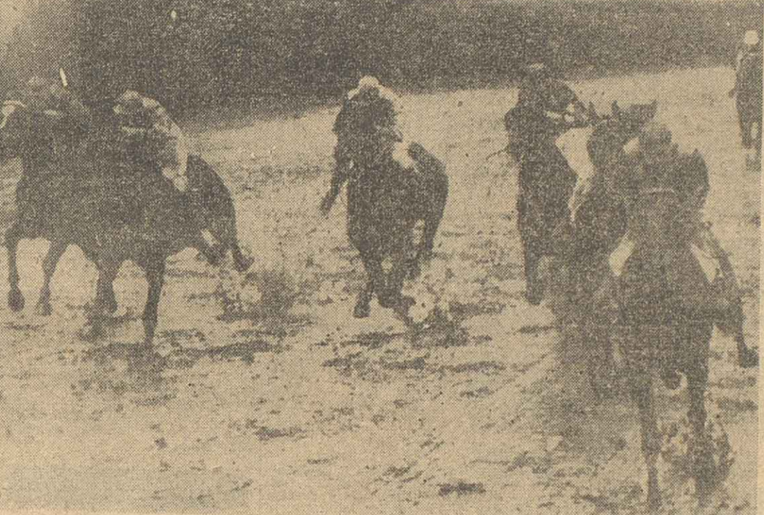
A cien metros de la largada, ya corre en la punta el velocísimo. Levando en su seguimiento a Ponce, con Baravand mal acomodado. Por el lado exterior se acomoda la yunita Eperón y Or. Monarca II, más atrás Barman y el mono leño Molinero, que largó parado.