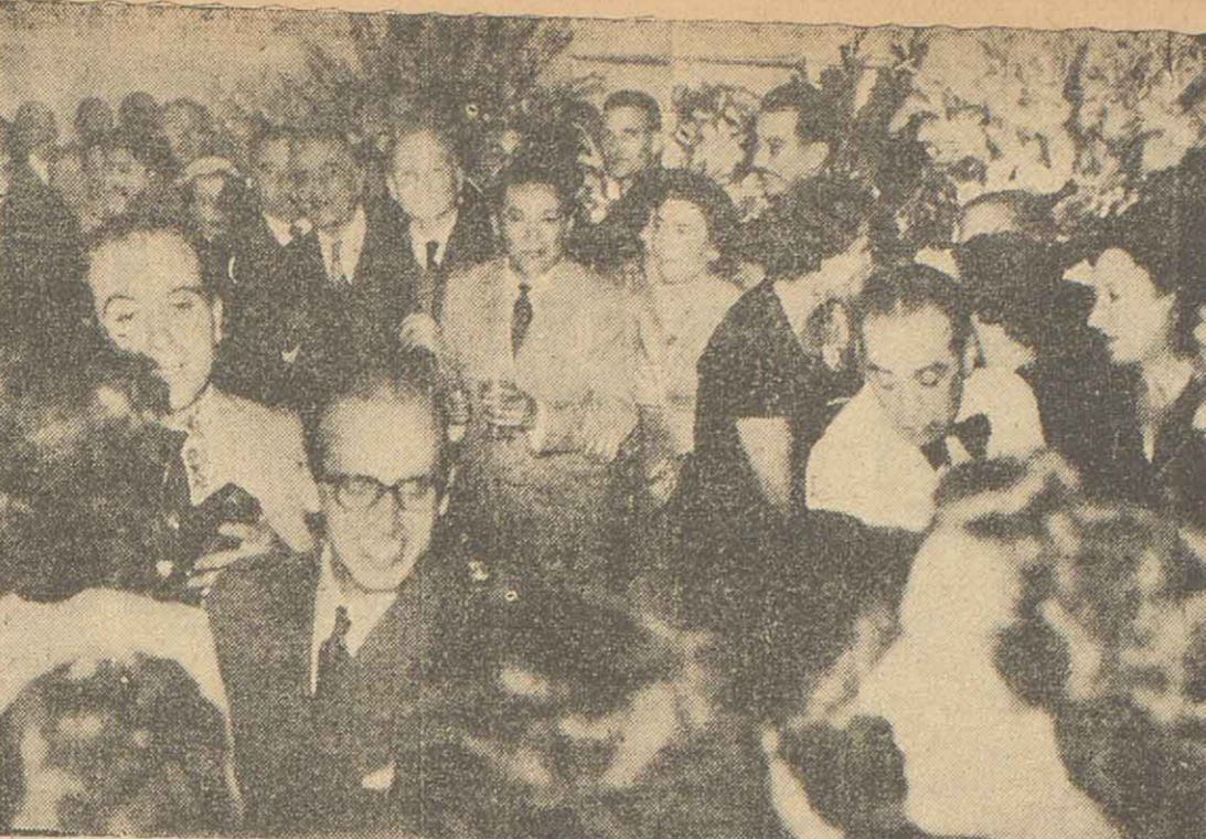
Vista parcial de la numerosa concurrencia que asistió ayer a la inauguración del local propio de la casa Piacenza, instalada en calle Rioja 1430, en momentos en que los asistentes al acto hacen los honores del "lunch" que fue dispuesto por la mencionada firma para su ajuar a sus visitantes.

INABILITACIONES Avanzando en su exposición, el doctor Allende expresó: "Es necesario que se levanten las inhabilitaciones políticas o gremiales, manteniéndose como en la ley electoral, sólo aquellos que respondan a hechos ilícitos seriamente juzgados. Esta medida hará temblar a más de uno de los pretendidos paladines de la conexión pública, porque les sacará las manos a una masa que llega al resentimiento y no por convicción; pero es la única solución que puede clarificar el ambiente, terminar con la demagogia existista y obligar a cada uno a luchar con el