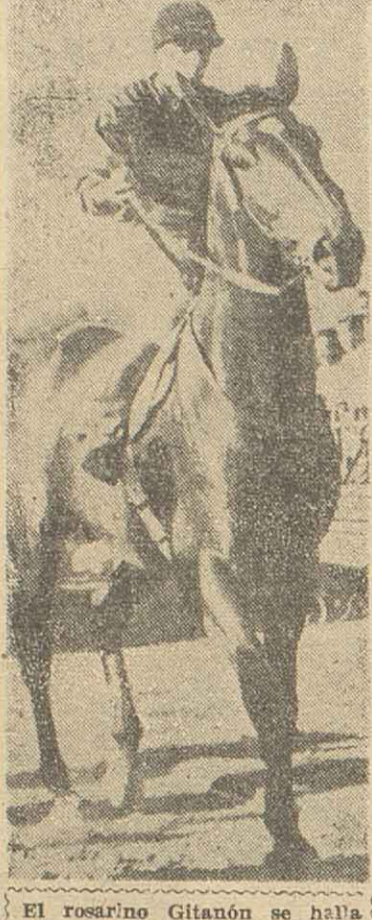
El rosarino Gitanón se halla listo para registrar una brillante marca en la prueba de tercer turno de mañana en Palermo.

20ª CARRERA — 1.100 METROS. BARRERA — 1.400 METROS.