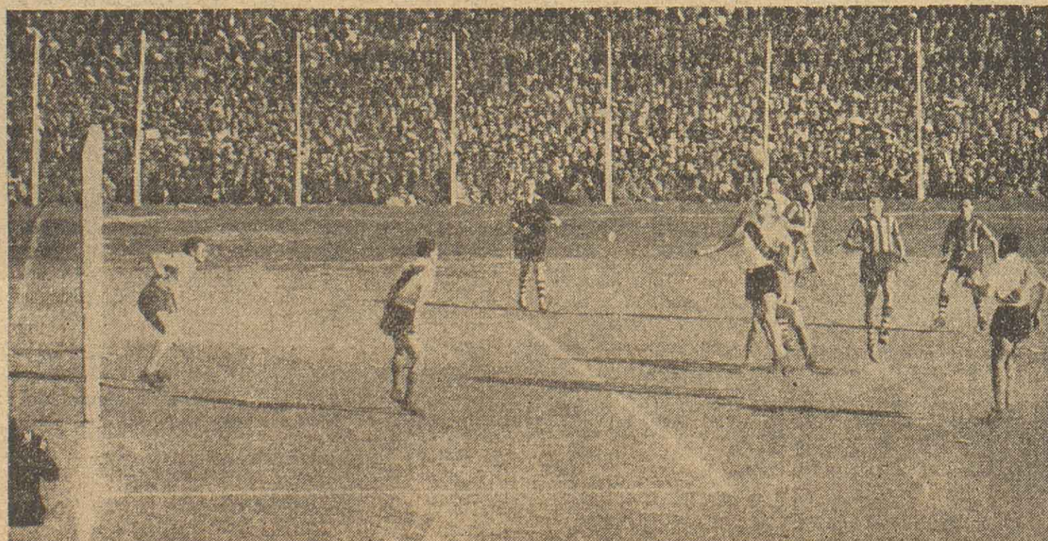
¿Se acuerdan? Fue el año pasado, en oportunidad de venir River a nuestra ciudad para enfrentarse con Rosario Central. "No cabía un alfiler" en la cancha, de tanta gente que concurrió a presenciar el partido. El asunto quedó mano a mano, ya que empataron en un gol por bando. Mañana vuelve a plantearse la incógnita, ya que chocarán Central y River, agudizándose la expectativa, por corresponder el match a la apertura del certamen 1957.

Por eso, se torna ardua, difícilísima por donde se la busque y se la mire, la cuestión a la divisa auriazul. Un triunfo frente a River Plate, en el pórtico augural de este torneo 1957, que se antoja formidable, significará quizás el espaldarazo que necesita Rosario Central para una campaña perlada de victorias brillantes. Puede significarle codearse en un mano a mano a lo largo del campeonato, con las casacas que siempre están disputando palmo a palmo los honores de resultar campeón. Todo eso, y la reconfortante sensación de haberle ganado nada menos que a River Plate, puede constituir la victoria centralista. Un traspie, pondría angustias de suspensio sobre la trayectoria auriazul en el curso del campeonato. Pero de todas maneras, vencedor o vencido, todo permite anticipar que Rosario Central producirá una performance excepcional, la actuación esperada de esa bizarra escuadra que dispuesta a jugrse entera en defensa de los queridos colores azul y oro, y que ha de agregar un jalón más de gloria a la ya gloriosa historia del fútbol rosarino. Esperemos que así sea. Mejor dicho, estamos seguros que así será. En esa confianza, nadie puede dudar de que el choque de mañana en el viejo barrio Arroyito, resultará realmente atómico. Ni los que saben de fútbol, ni los que de fútbol sólo saben que la pelota es redonda.