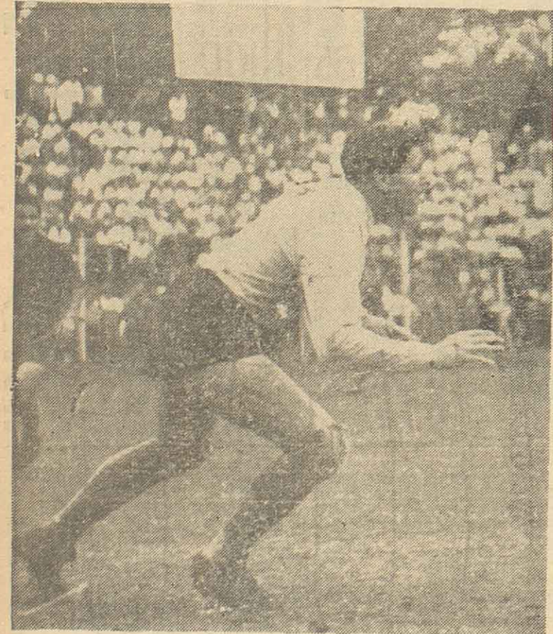
Ya consagrado Domínguez, el director Stábile quiere brindar al guardavalla suplente, Roma, la oportunidad de demostrar ante el público limeño sus notables condiciones. Últimas noticias afirman que el defensor de Ferro será el encargado de custodiar nuestra valla en el match de esta noche contra Perú.

LIMA, 6 (Especial). — Esta noche Argentina y Perú, en Lima, finalizarán sus respectivas campañas y con ellas el 19º Campeonato Sudamericano de Fútbol. Un campeonato que se fue desarrollando al compás de lo que cantaban, inicialmente,