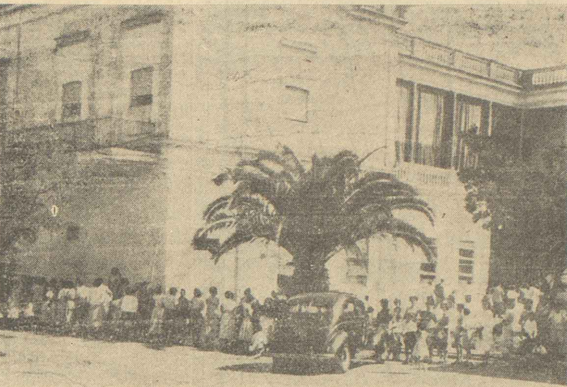
En todas las dependencias locales donde se vacuna a los escolares, hubo en la mañana de hoy extraordinaria afluencia de niños...