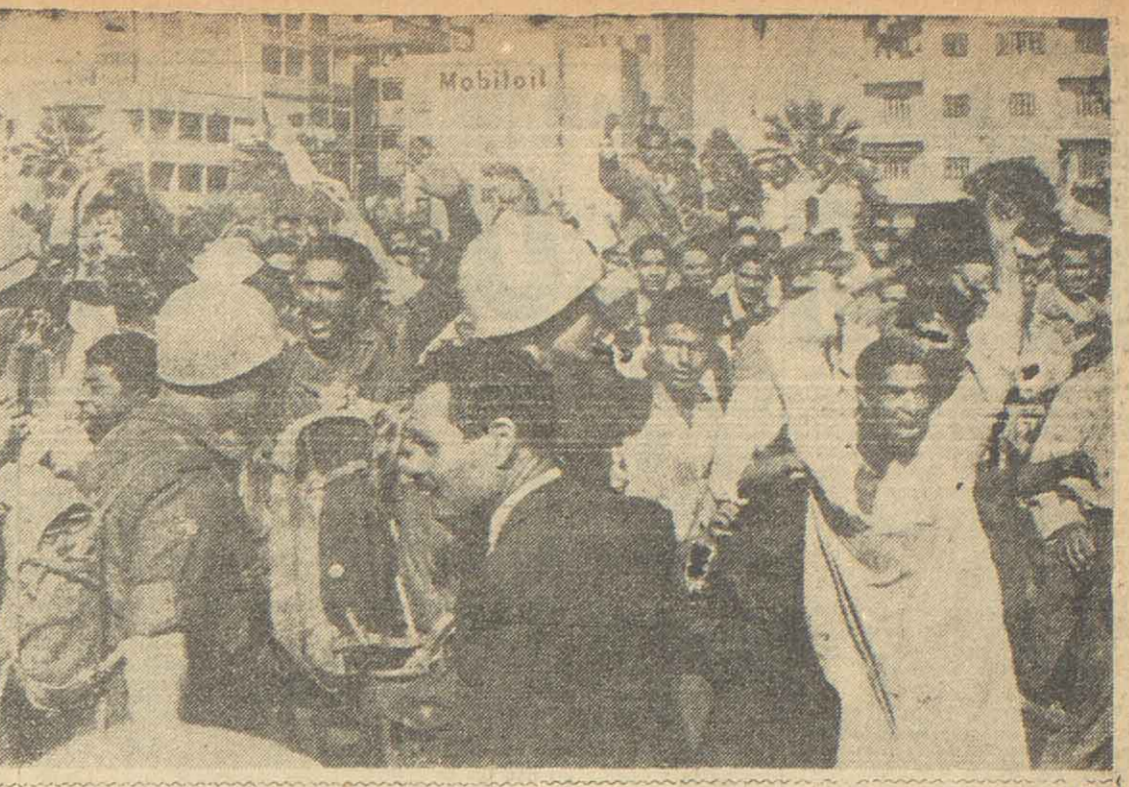
Esta nota gráfica fue captada en Port Said cuando aún no se habían retirado de la ciudad, luego del Canal de Suez, las tropas inglesas. Los soldados británicos tratan de proteger a las fuerzas de la UN de la enloquecida adhesión que le tributa los egipcios, a la vez que se protegen ellos mismos de su cólera. Escenas similares se sucedieron en Gaza al evacuar la ciudad y la zona en litigio los efectivos israelíes, aunque esa operación se llevó a cabo dentro del mayor orden y no hubo exteriorizaciones adversas para sus ocupantes. El pueblo de Gaza supo hacer distinciones.

Visita Buenos Aires, Yul Brynner, artista de ascendencia mongólica y gitana, nacido en el Japón, y de exitosa actuación en los estudios cinematográficos norteamericanos. Por su extraña y fuerte personalidad se perfila como un fuerte rival de los grandes rudos. Brynner tuvo que esperar 20 años para alcanzar el éxito que hoy detenta en la cinematografía mundial.