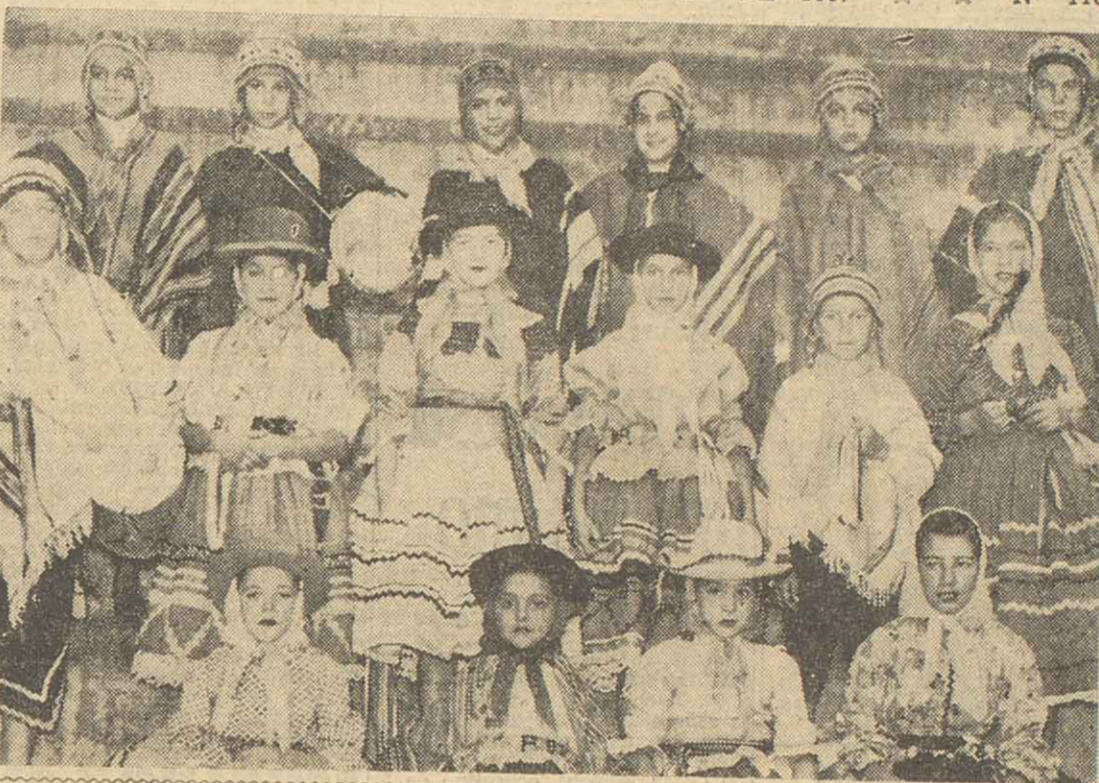
Conjuntos como éste, denominado "Albor Gaucho", mantuvieron viva la llama de la tradición en los bulliciosos festejos de Carnaval. Sus pequeños integrantes, ataviados con ropas características del altopiano, tomaron parte en el concurso realizado en las instalaciones de la Exposición Rural con el auspicio de la comuna. También el varaví, al ritmo de la caja chavera, le salió al cruce al rock, que se batió en retirada ante el asedio de la música mestiza.

REGIST. PROP. INTEL. N° 518.422 — SAN LORENZO 1254 — T. E. 47061-96 — Ejemplar $ 0.80 AÑO IV * * * ROSARIO, MARTES 5 DE MARZO DE 1957 * * * N° 1160