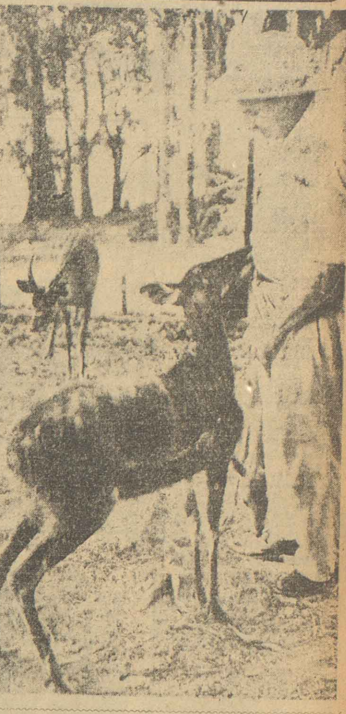
No solo los abandonados negros del África Central fueron y son sus mejores amigos. También los animales, para quienes le dedica horas consagradas a su dedicación, se llegan hasta el gran maestro de tribus africanas, trasponiendo las barreras de la cultura y el idioma, y de sacrificio, es un verdadero mensaje a las civilizaciones y su ejemplo, muy pocas veces igualado, un toque de atención para las nuevas generaciones, cargadas de inquietud e incertidumbre.