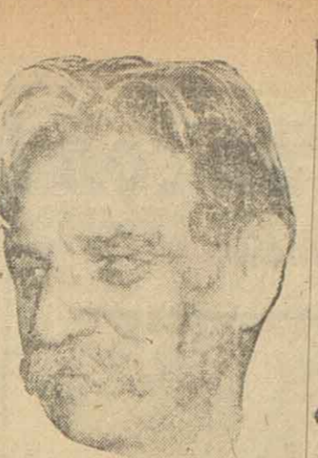
Alberto Schweitzer, continuó en el corazón del África, la lucha que iniciara hace ya muchos años, contra el mal, la inercia y el abandono de aquella zona del mundo. Lejos de los progresos de la civilización y la ciencia y muy cerca de la barbarie. Su espíritu maravilloso, hizo posible el milagro. Los negros le llamaron el "mago de los felices" y Premio Nobel de la Paz. He aquí resumida toda una historia de amor y sacrificio por y para sus semejantes.

Una importante resolución ha tomado el VII congreso del radicalismo de Luz y Fuerza, que por el cumplimiento del convenio suscrito y ratificado por resolución ministerial N.º 160. Luego de dejar constancia que Agua y Energía (ENDE) ha abonado íntegramente el pago de los salarios de los trabajadores que presta servicios en las plantas, expresamente que se realiza un paro de Luz y Fuerza, que se realizará por un período de 24 horas, expresamente que se realiza un paro de Luz y Fuerza, que se realizará por un período de 24 horas, expresamente que se realiza un paro de Luz y Fuerza, que se realizará por un período de 24 horas.