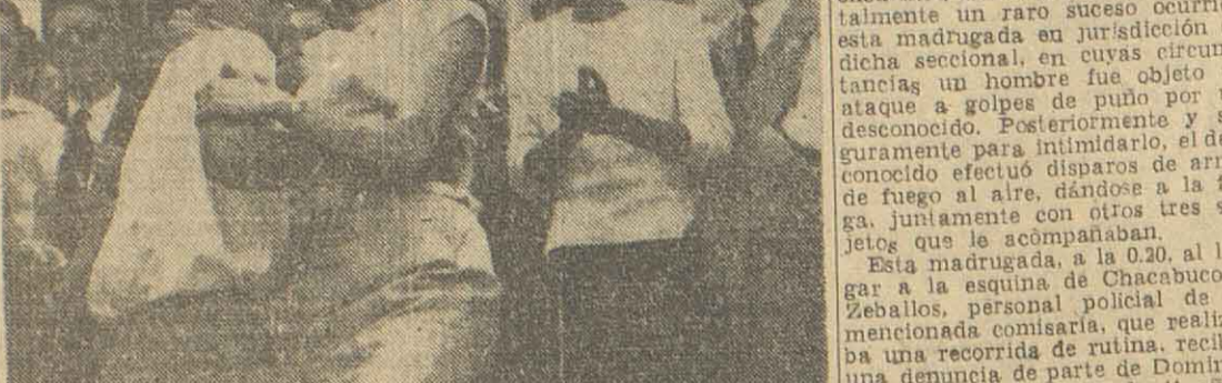
Personal de la comisaría 1ª se encuentra abocado a esclarecer totalmente un raro suceso ocurrido esta madrugada en jurisdicción de dicha seccional, en cuyas oficinas se halla un sujeto de puño por un desconocido.

Personal de la comisaría 1ª se encuentra abocado a esclarecer totalmente un raro suceso ocurrido esta madrugada en jurisdicción de dicha seccional, en cuyas oficinas se halla un sujeto de puño por un desconocido. Posteriormente y seguramente para intimidarlo, el desconocido efectuó disparos a la fuga, resultando con otros tres sujetos que lo acompañaban.