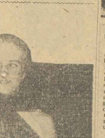
Aquí está en plena acción Alberto Schweitzer, el médico filósofo que un día, dijo adiós a la vida mundana, y junto a su sacrificada esposa, partió rumbo al desierto. En su corazón cargado de amor hacia sus semejantes una misión, la de consolar a los que sufren. Su meta fue lograda ampliamente y hoy su figura perdurará, es un símbolo para la humanidad. En África, como en Europa y América, Schweitzer significa todo lo que el hombre puede dar, en su fugaz paso por la vida.