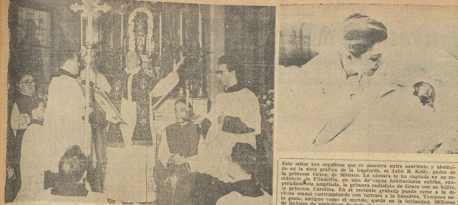
Este señor tan orgulloso que se muestra entre sonriente y abstraído en la foto gráfica de la izquierda, es John B. Kelly, padre de la princesa Grace, de Mónaco. La cámara lo ha captado en su residencia de Filadelfia, en una de cuyas habitaciones exhibe, exheredatadamente ampliada, la primera radiografía de Grace con su hija, la princesa Carolina. En el restante grabado puede verse a la diestra, chosa mamá contemplando con ternura a la heredera. Tiempo es esta escena y el mundo, quedó en la intimidad. Millones de lectores de periódicos de todo el mundo están familiarizados con esta escena tanto como el romance de la ex actriz con Rainiero III, su enlace y la herencia del primer hijo, que resultó ser una niña.