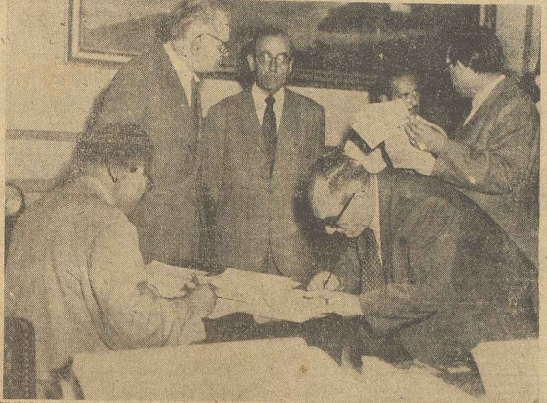
Ante las autoridades de la Junta Municipal de Abastecimiento, en el acto de apertura de licitación realizado esta mañana, los licitantes proceden a firmar el acta e iniciar las propuestas. Cabe señalar que el organismo municipal dijo como tope de la licitación $ 349 el kilogramo, habiéndose presentado todas las propuestas por debajo de ese precio: 3.39, 3.15 y 3.98 pesos.

BUENOS AIRES, 30 (S). — En una zona que comprendió la capital Federal y a Gran Buenos Aires se registró durante las últimas 12 horas un marcado descenso de la temperatura que en la mayoría de las zonas bajó de 43° a 31°, no registrándose en esta capital desde hace 100 años y que causó el lamentable saldo de 23 muertos en la Capital Federal y 12 en la zona de Avellaneda.