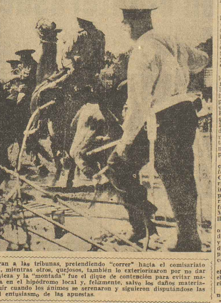
La documental: parte del público ha destruido las verjas que separan a las tribunas, pretendiendo "correr" hasta el comisariato para elevar su voz de protesta por el distanciamiento de Personera, mientras otros, quejosos, también lo exteriorizaron por no dar se el triunfo a la yegua Adémica. La policía tuvo que actuar con prontitud y la "nomada" fue el dique de contención para evitar males mayores. El triste espectáculo, hacia varios años que no se daba en el hipódromo local y, felizmente, salvo los daños materiales causados en las instalaciones del Hipódromo, la reunión pudo seguir cuando los ánimos se serenaron y siguieron disputándose las carreras, en el ambiente propio