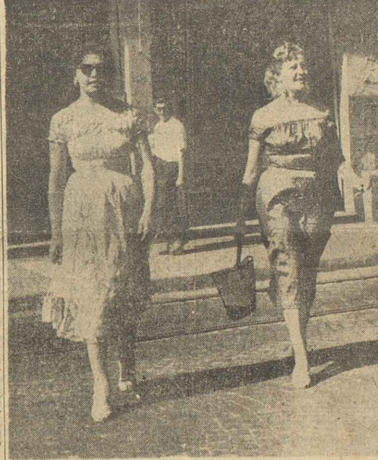
En Las Vegas, Miami y Hollywood hay mujeres hermosas y las cámaras cinematográficas no se cansan de filmarlas. En Rosario acostumbrados estamos a verlas, que a veces no olvidamos de que también en Rosario las bellezas abundan. Este enfoque de nuestro inquisito fotógrafo se encarga de recordárnoslo. En la tarde rosarina el sol doró sus hombros y los hombres adoran su presencia en las calles.

De acuerdo con la declaración de Kossium, "varios amigos suyos que examinaron la "moladora de carne" aseguraron que tenía pedruzcos de restos humanos", como una "pulpita de carne humana" enredada en sus cilindros".