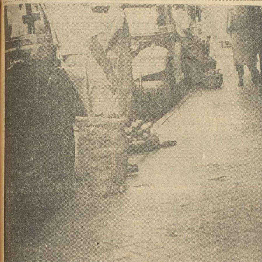
Este es uno de los 96 automóviles de alquiler que circulan desde esta mañana por las calles de nuestra ciudad. El público, con entera satisfacción, pudo comprobar como la primera etapa del plan anunciado por la municipalidad, se viene cumpliendo al pie de la letra.