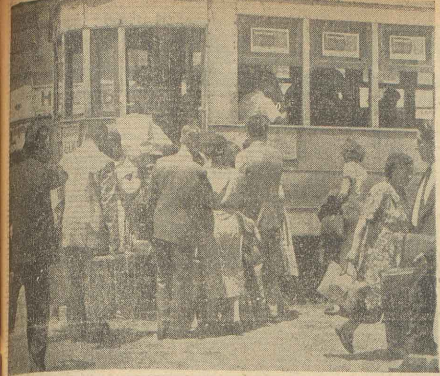
Otra vez volvieron a repetirse los inconvenientes al arribo de viajeros a las estaciones de la ciudad. La falta de taxis obligó a que se produjeran escenas como la que ilustra la nota gráfica. Pese a la buena voluntad de su personal, los vehículos de la Empresa de Transporte resultaron inadecuados para conducir las valijas y bultos.