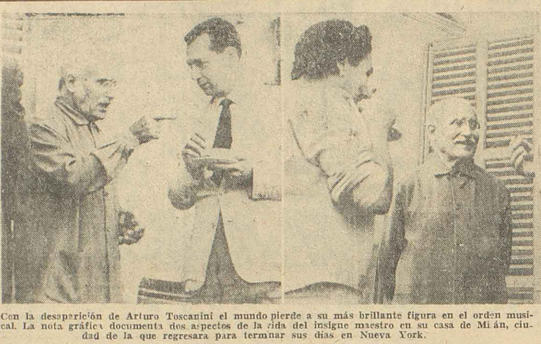
Con la desaparición de Arturo Toscanini el mundo pierde a su más brillante figura en el orden musical. La nota gráfica documenta dos aspectos de la vida del insigne maestro en su casa de Mián, ciudad de la que regresara para terminar sus días en Nueva York.

CREMER OFRECE Licuadora ROTMIX super luxe $76 POR MES LUSTRADORA NADIR $86 POR MES Con 6 cepillos y 3 franetas. Pulen, encierran, lustran y dan brillo. SAN MARTIN 1935 - T. E. 86209