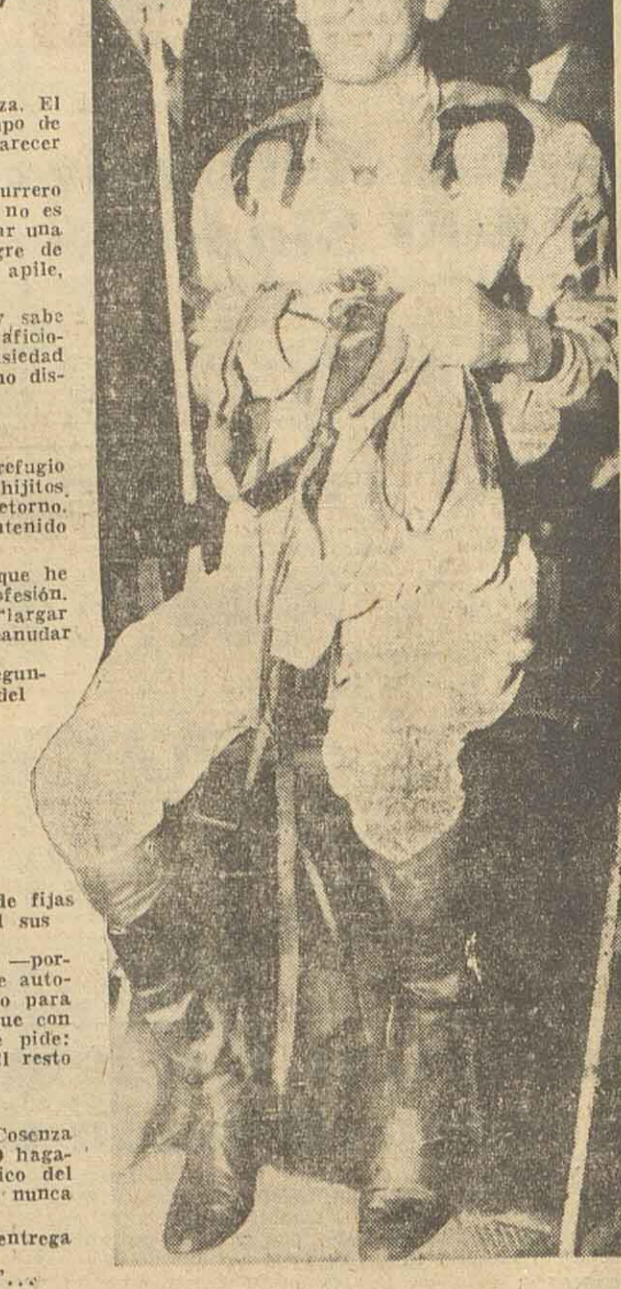
Charles de paso Jugando a los ganadores

—No sea canito, viejo... para esa me quedo con Persistencia. —Per... sí, ché, que va bien trabado.