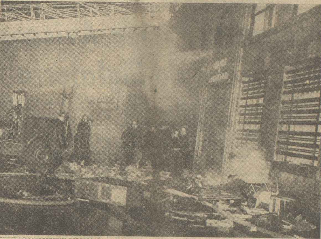
Aquí se quemaron nada menos que 1200.000 dólares en efectivo pero, se salvaron 300 millones! El siniestro ocurrió en un banco de Massachusetts, donde el fuego alcanzó sólo al dinero depositado en uno de los escritorios; el que guardaba la caja de caudales quedó intacto, a pesar de que el edificio debido a la magnitud del incendio se derrumbó en su mayor parte.

REGIST. PROP. INTEL. N° 518422 — SAN LORENZO 1954 — T. E. 67032 - 86 Ejemplar $ 0.80 AÑO IV * * * ROSARIO, MARTES 8 DE ENERO DE 1957 * * * N° 1105