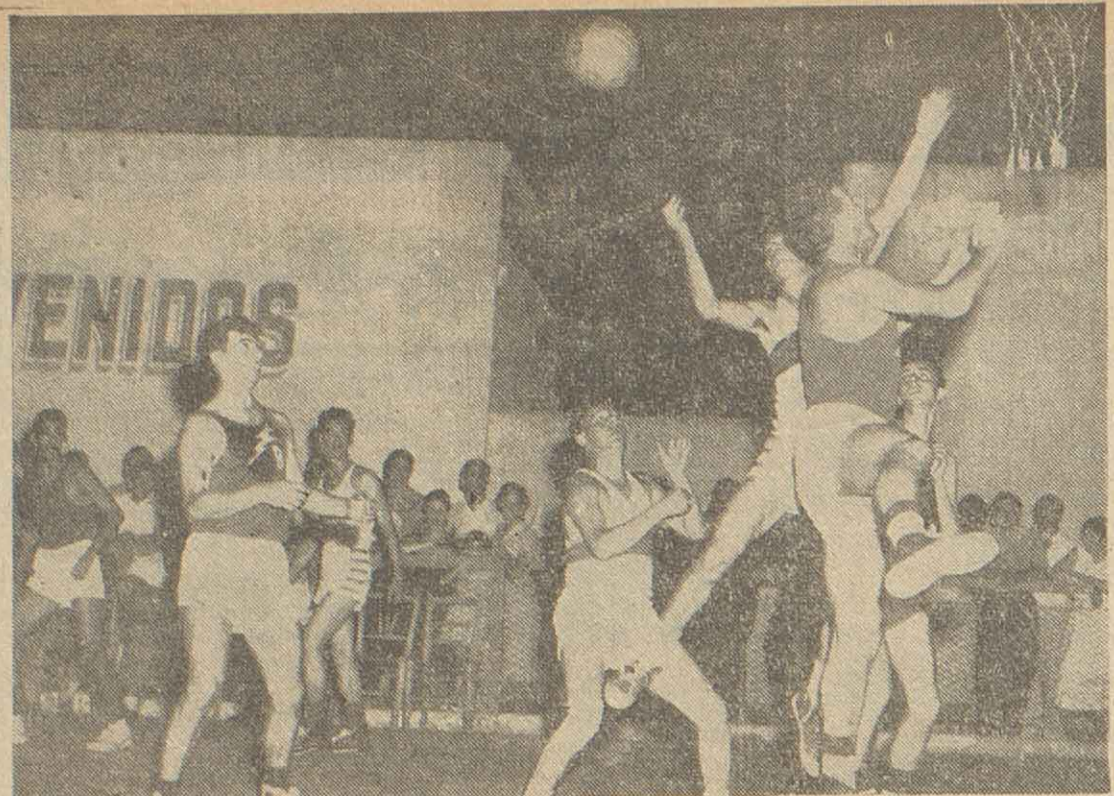
El pelota está en el aire luego de haber rebotado en el tablero, impulsado por un hombre de Velocidad, en tanto que uno de sus compañeros y un defensor de Uría fallan en su intento de alcanzarla. La jornada cumplida anoche en cancha de Unión River Paraná, resultó sumamente interesante.