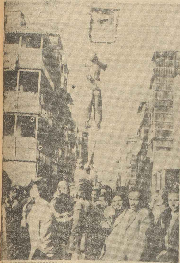
Luego de que las tropas de las Naciones Unidas, juntamente con unos efectivos egipcios, se hicieron cargo de la semidesnuda zona de Suez, el pueblo se lanzó a las calles y en fanáticas manifestaciones, dio muestras de apoyo al dictador Nasser. Aquí vemos a un grupo de manifestantes luego de haber colgado en los cables eléctricos un muñeco vestido con el uniforme del ejército inglés.