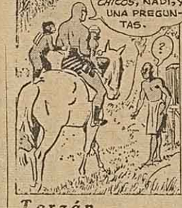
por Walt Disney