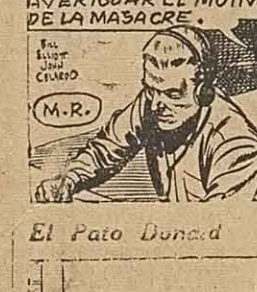
por Lino P...