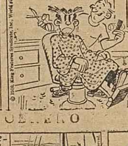
por Lino P...