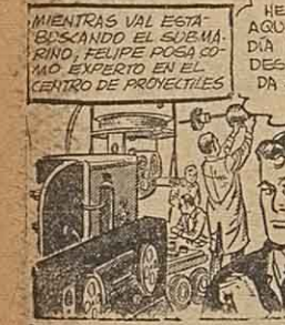
Penita y Lorenzo