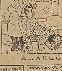
por Walt Disney