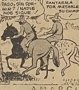
por Walt Disney