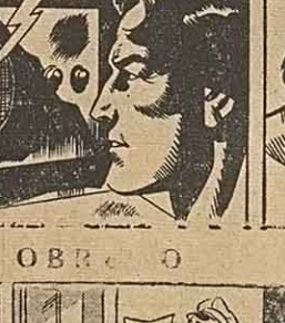
por Lino P...