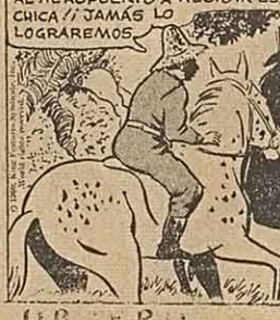
por Alex Raymond