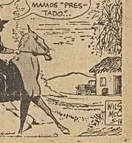
por Lino P...