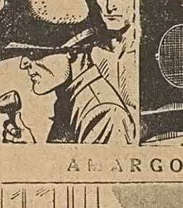
por Lino P...